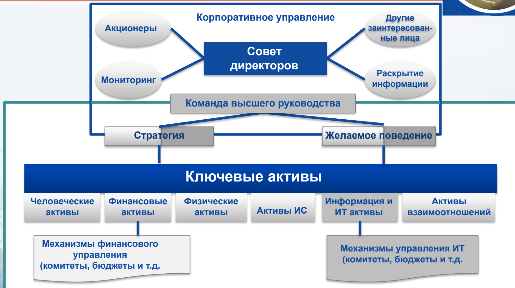
Рис. 1.1. Корпоративное управление и управление ключевыми активами

■ – активы ИТ; активы ИС – активы интеллектуальной собственности.