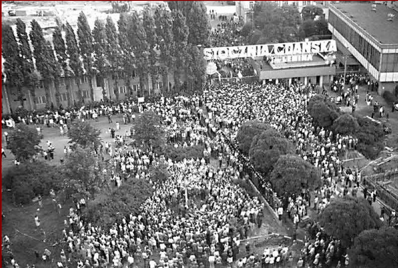
Забастовка, организованная Лехом Валенсой Судоверфь имени В.И. Ленина в г. Гданьск (Польша). 1970-начало – 1980-х гг.