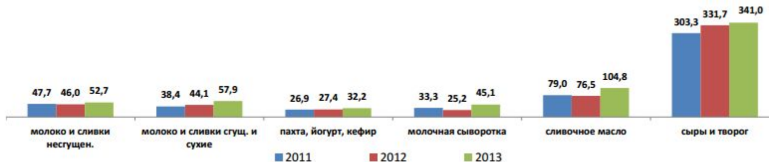
ДИНАМИКА ИМПОРТА МОЛОЧНОЙ ПРОДУКЦИИ, ТЫС. ТОНН

В 2013 году по всем видам молочной продукции наблюдалось увеличение по сравнению с 2012 годом импортных поставок: молока и сливок несгущенных – на 14,6%, сгущенных и сухих – на 31,3%, кисломолочной продукции – на 17,5%, сливочного масла – на 37%, сыров и творога – на 2,8%, а также молочной сыворотки – в 1,8 раза.