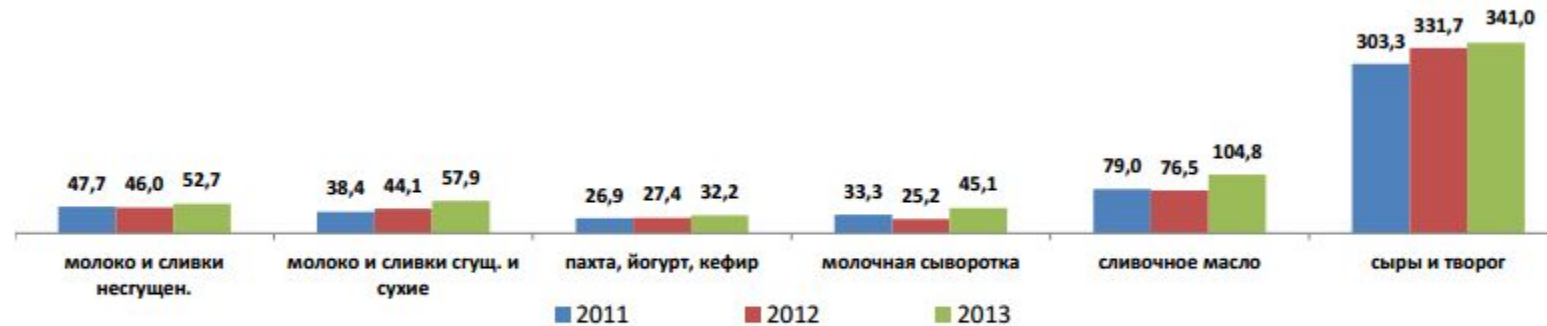
ДИНАМИКА ИМПОРТА МОЛОЧНОЙ ПРОДУКЦИИ, ТЫС. ТОНН

В 2013 году по всем видам молочной продукции наблюдалось увеличение по сравнению с 2012 годом импортных поставок: молока и сливок несгущенных – на 14,6%, сгущенных и сухих – на 31,3%, кисломолочной продукции – на 17,5%, сливочного масла – на 37%, сыров и творога – на 2,8%, а также молочной сыворотки – в 1,8 раза.