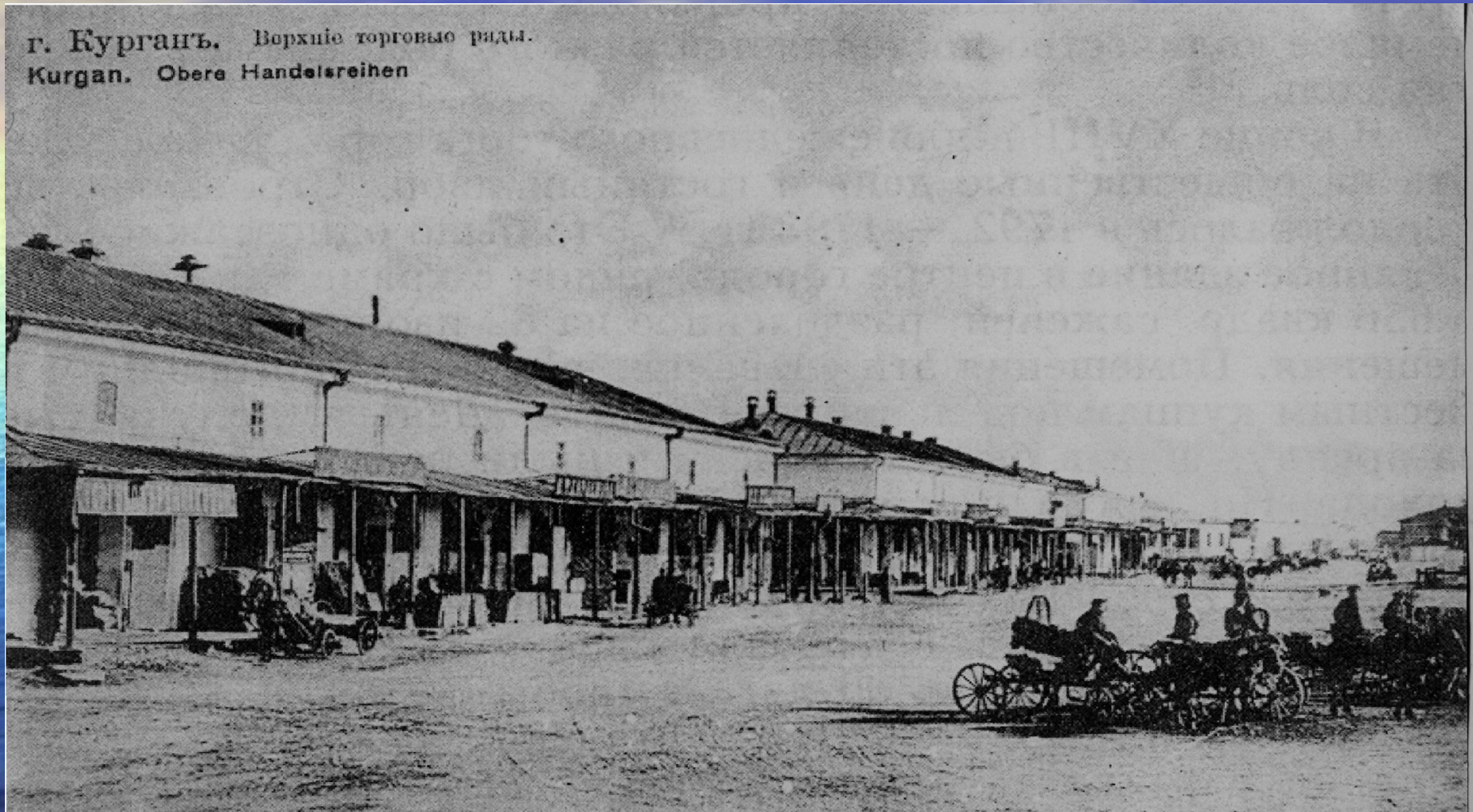
г. Курганъ. Верхніе торговые ряды. Kurgan. Obere Handelsreihen