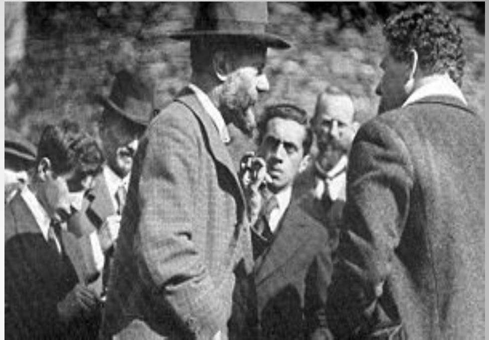
Макс Вебер среди своих студентов, 1917 год