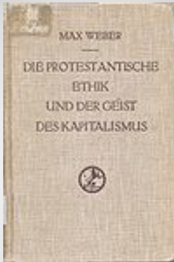
Протестантская этика и дух капитализма, первое издание