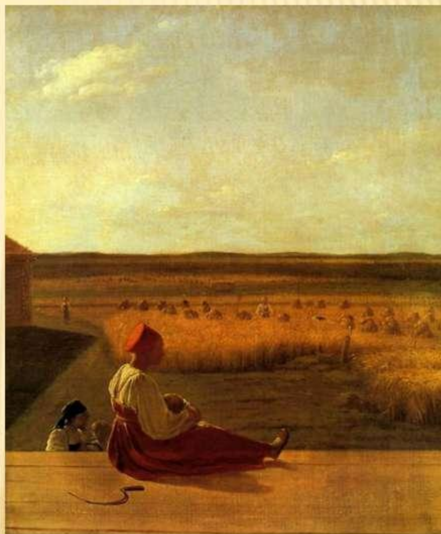
А.Венецианов «На жатве»