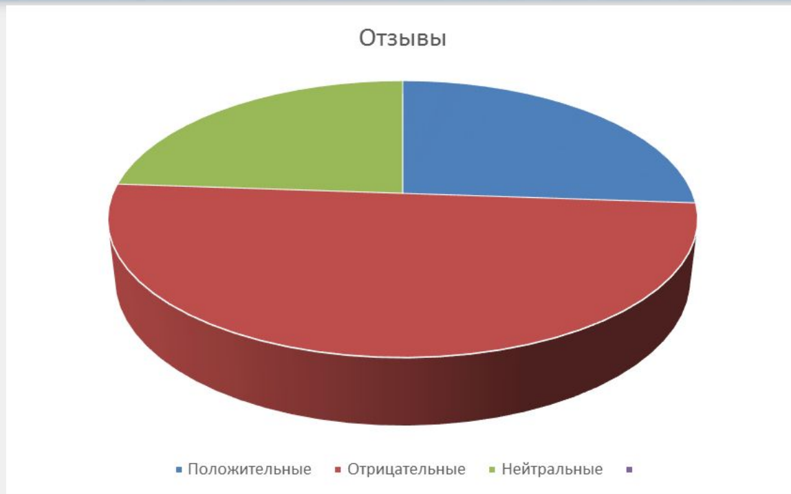
Рисунок 1 - Отзывы потребителей туристских услуг