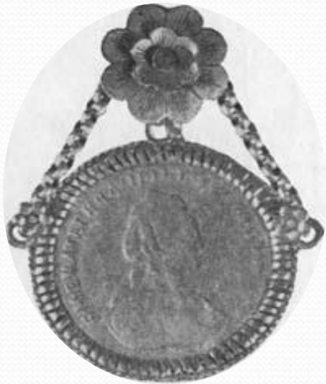
Дукач - украинское народное женское украшение, сделанное из монеты XVIII в.

Основными металлами для изготовления монет в течение столетий были золото, серебро и медь. Государство или правитель, чеканившие деньги, удостоверяли как точность веса, так и пробу сплава монеты.