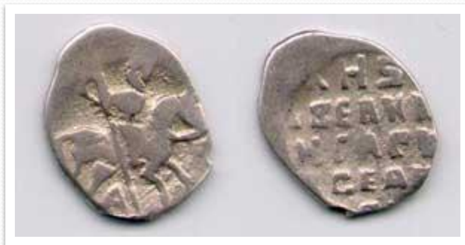
Копейка времен Ивана Грозного

Основными действиями правительства в области денежного обращения стали конъюнктурное изменение весовой нормы монет и пробы сплава монет из драгоценных металлов, а также увеличение объема монетной чеканки.