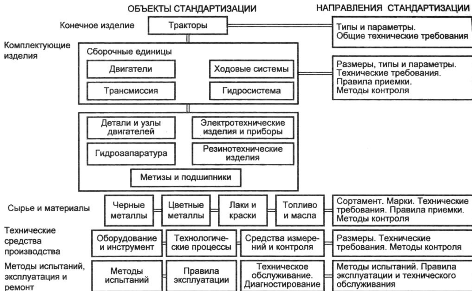
Рис. 1.2. Реализация программы комплексной стандартизации