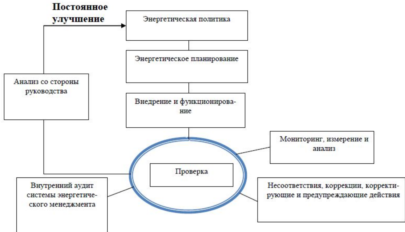
Модель энергетического менеджмента