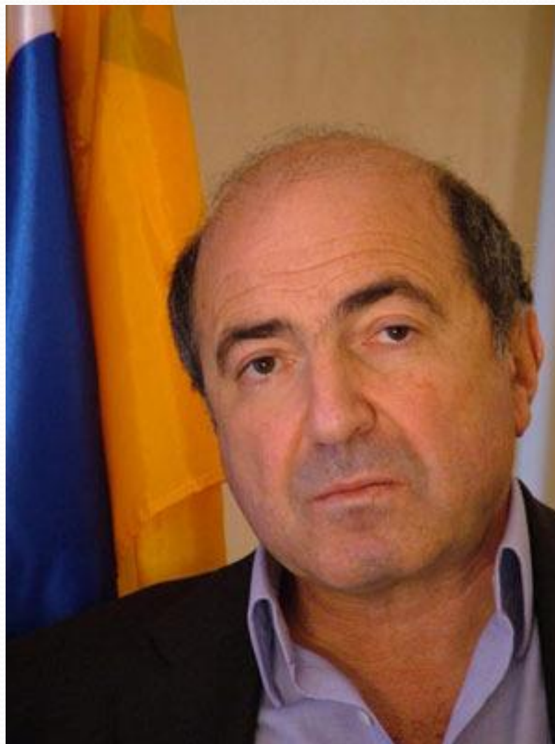
Борис Абрамович Березовский