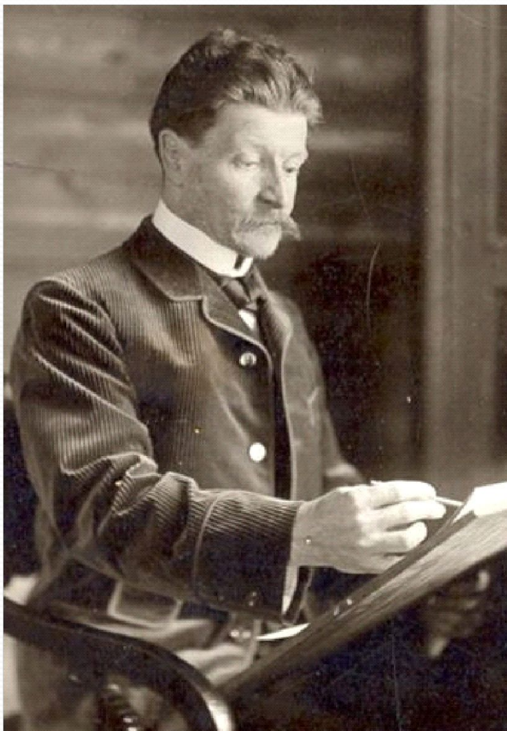
Михаил Александрович Врубель (1856 – 1910)