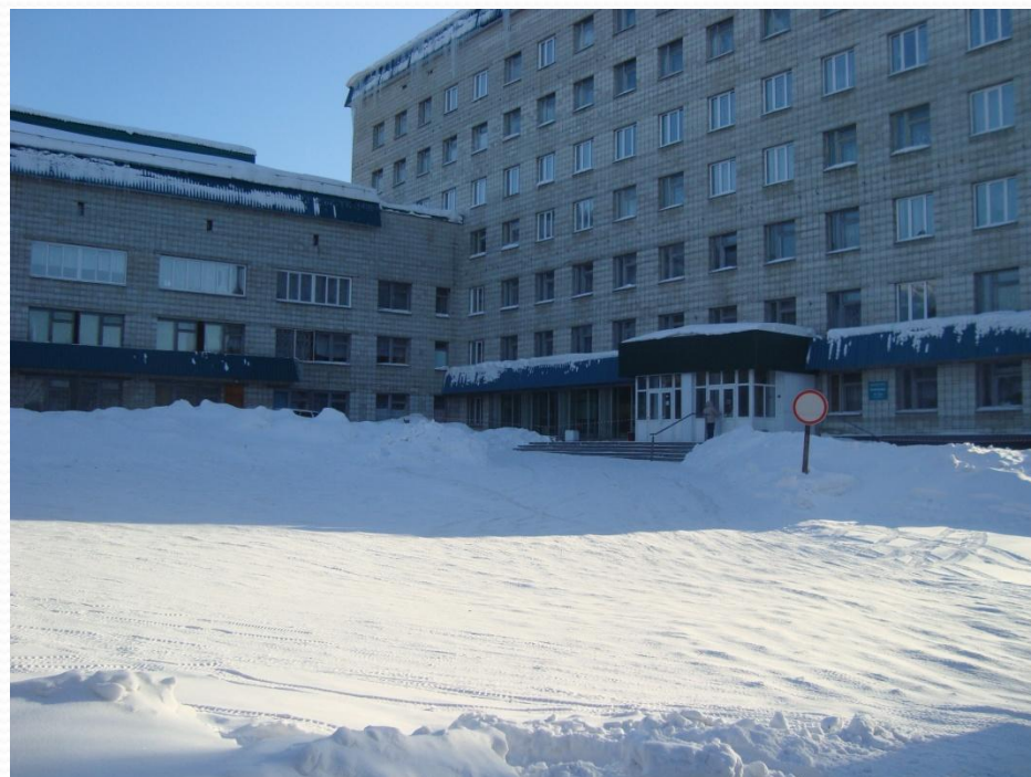
КБ – 51 Поликлиника г. Железногорска