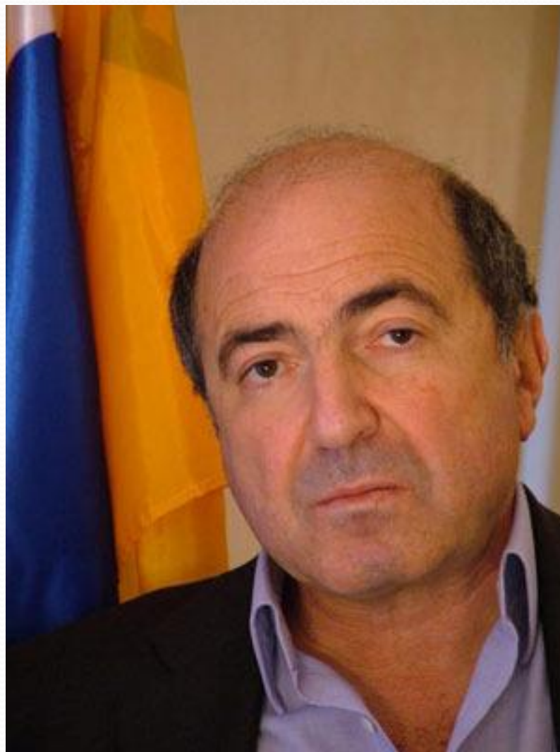
Борис Абрамович Березовский