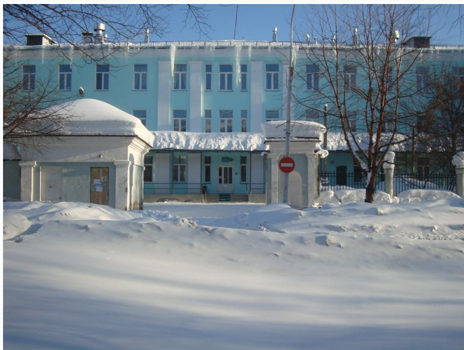
Детский стационар Г. Железногорска