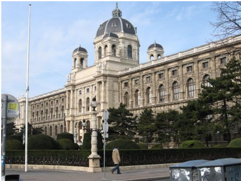
Музей изящных искусств