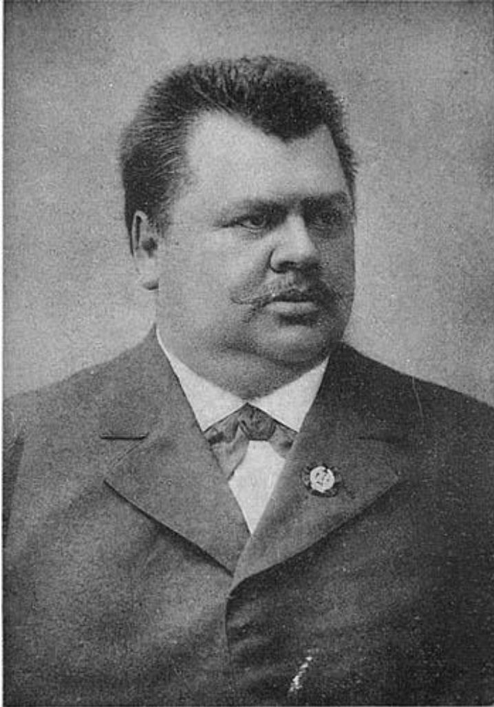
Алексей Петрович Бахрушин (1853—1904)