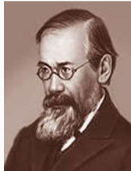
Василий Осипович Ключевской (1841 – 1911)