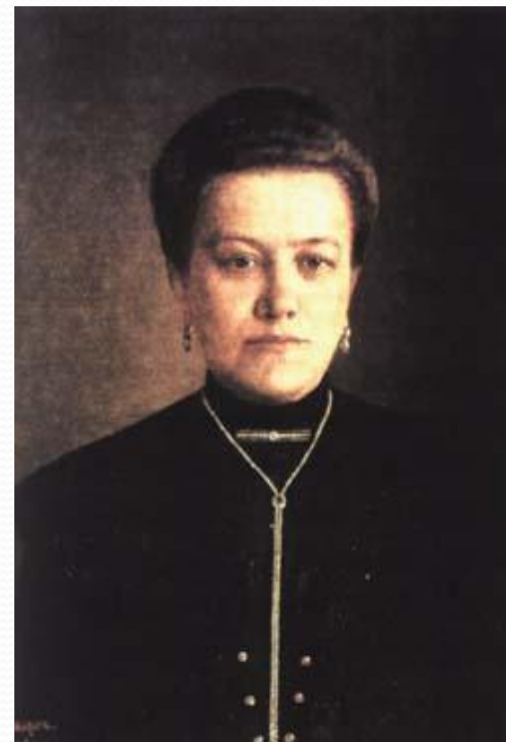
Варвара Алексеевна Морозова (1850 – 1913)