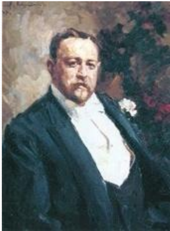
Савва Тимофеевич Морозов (1862 – 1905)