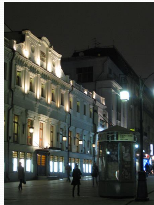
Московский Художественный театр