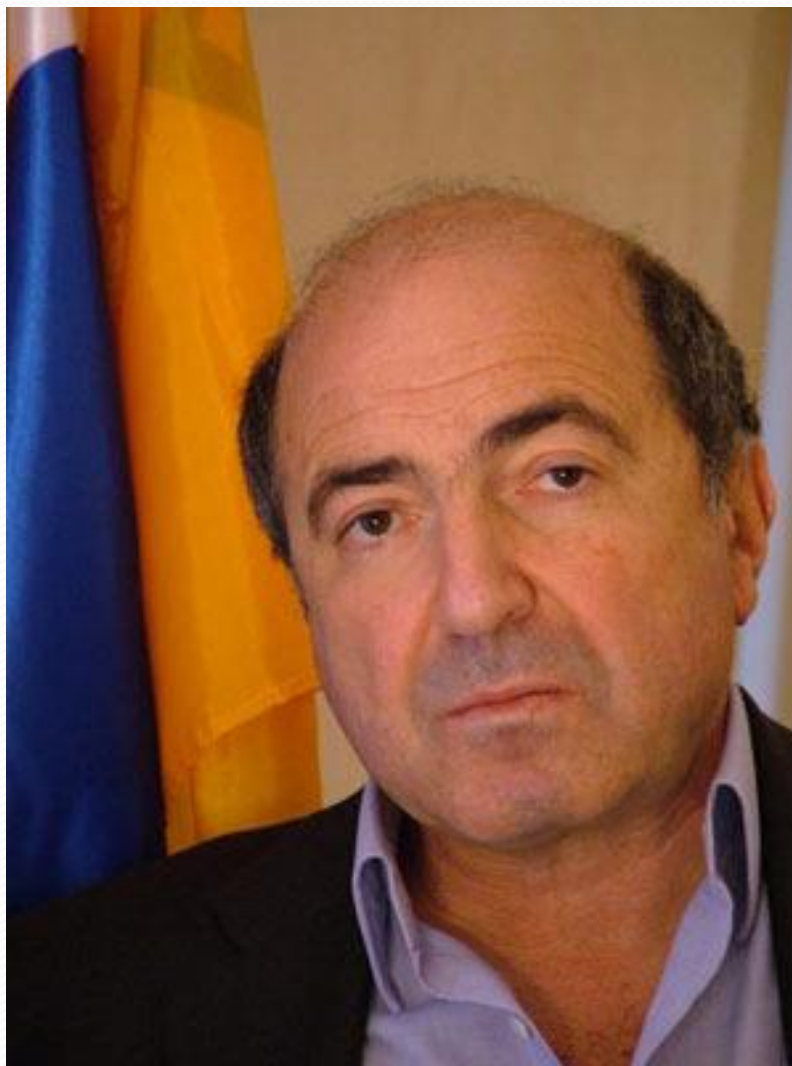
Борис Абрамович Березовский