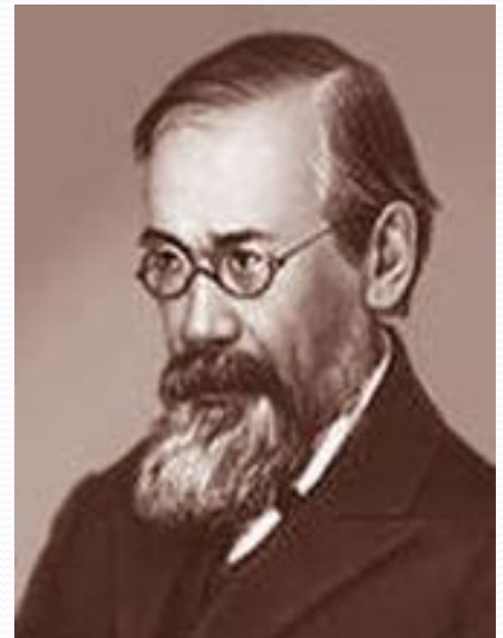
Василий Осипович Ключевской (1841 – 1911)