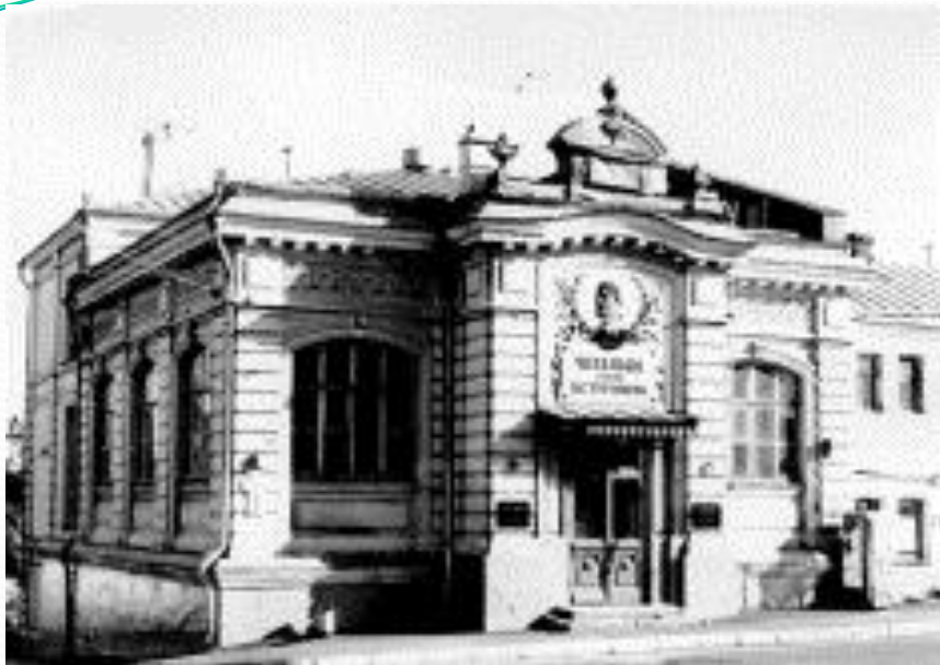
Бесплатная библиотека-читальня им. И. С. Тургенева