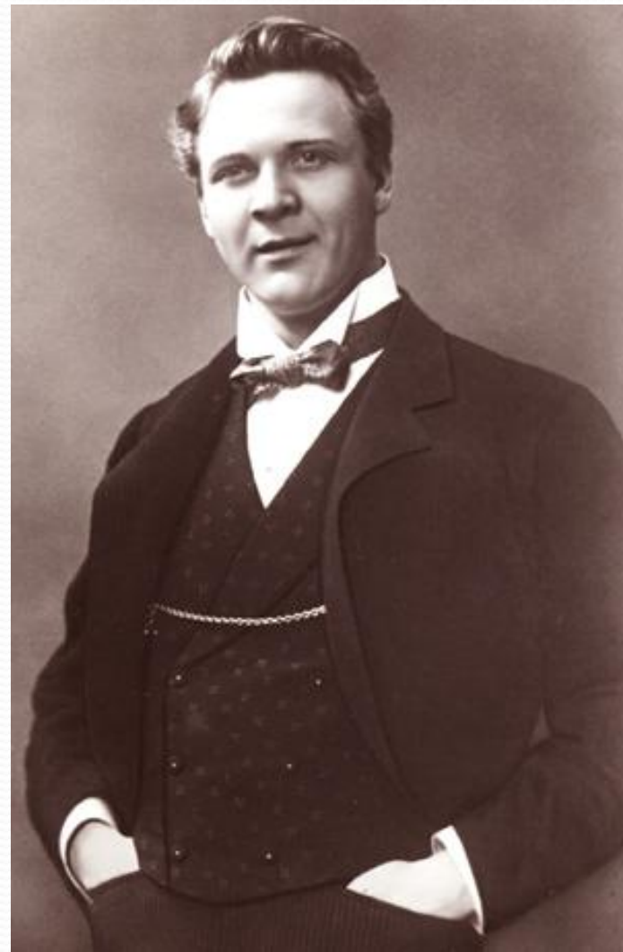
Федор Иванович Шаляпин (1873 – 1938)