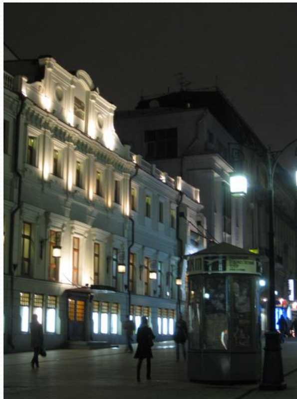
Московский Художественный театр