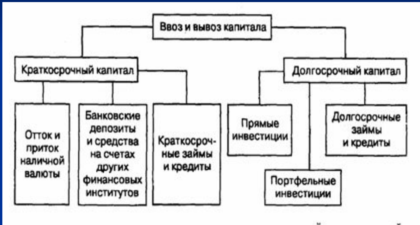
Рис. 1. Основные формы международного перемещения капитала