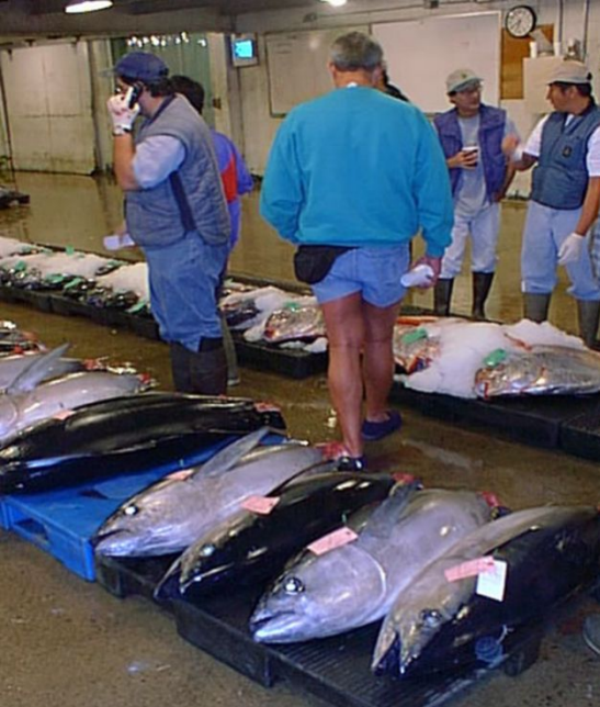
Рыбный аукцион в Гонолулу,