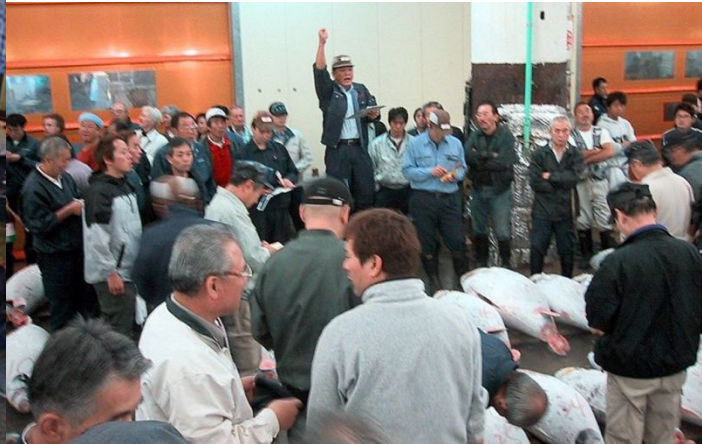
Аукцион по продаже тунца