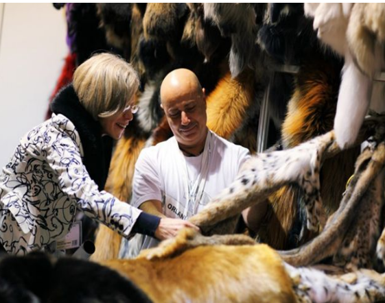
Аукцион по торговле пушниной