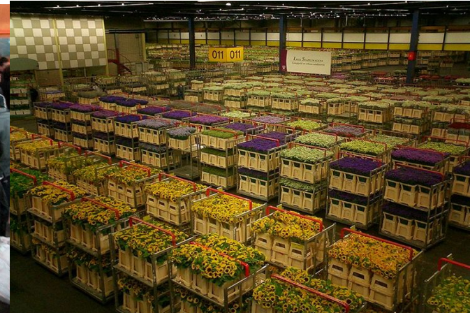
Склад аукциона по продаже цветов в Алсмере, Нидерланды