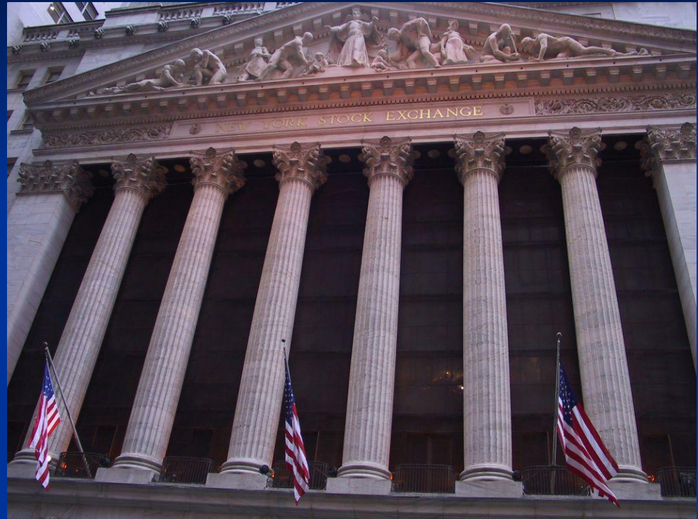
Нью-Йоркская фондовая биржа