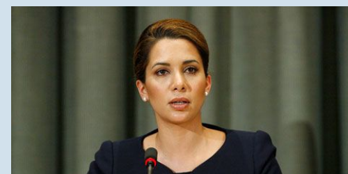
ПРИНЦЕССА ХАЙА БИНТ АЛЬ ХУССЕЙН