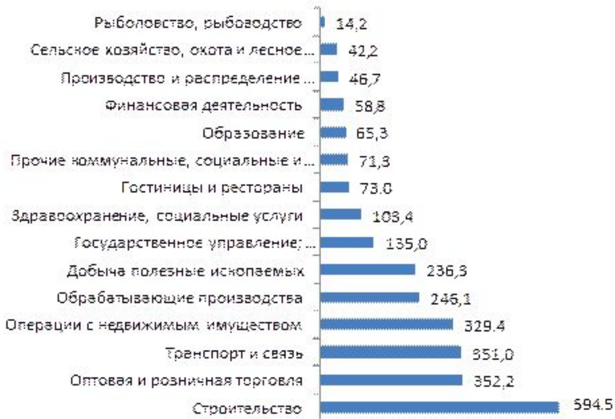
Распределение занятого населения, работающего за пределами своего субъекта, по видам экономической деятельности в 2016 году тыс. человек