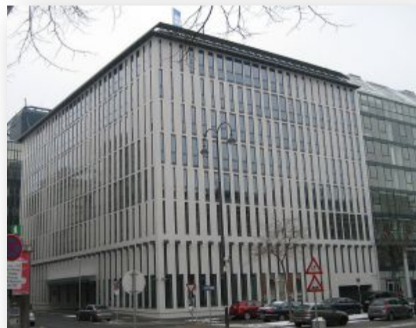
Штаб-квартира расположена в Вене

Международная межправительственная организация, созданная нефтедобывающими странами в целях стабилизации цен на нефть. В состав ОПЕК входят 12 стран: Иран, Ирак, Кувейт, Саудовская Аравия, Венесуэла, Катар, Ливия, Объединённые Арабские Эмираты, Алжир, Нигерия, Эквадор и Ангола. С 1998 года Россия является наблюдателем в ОПЕК.