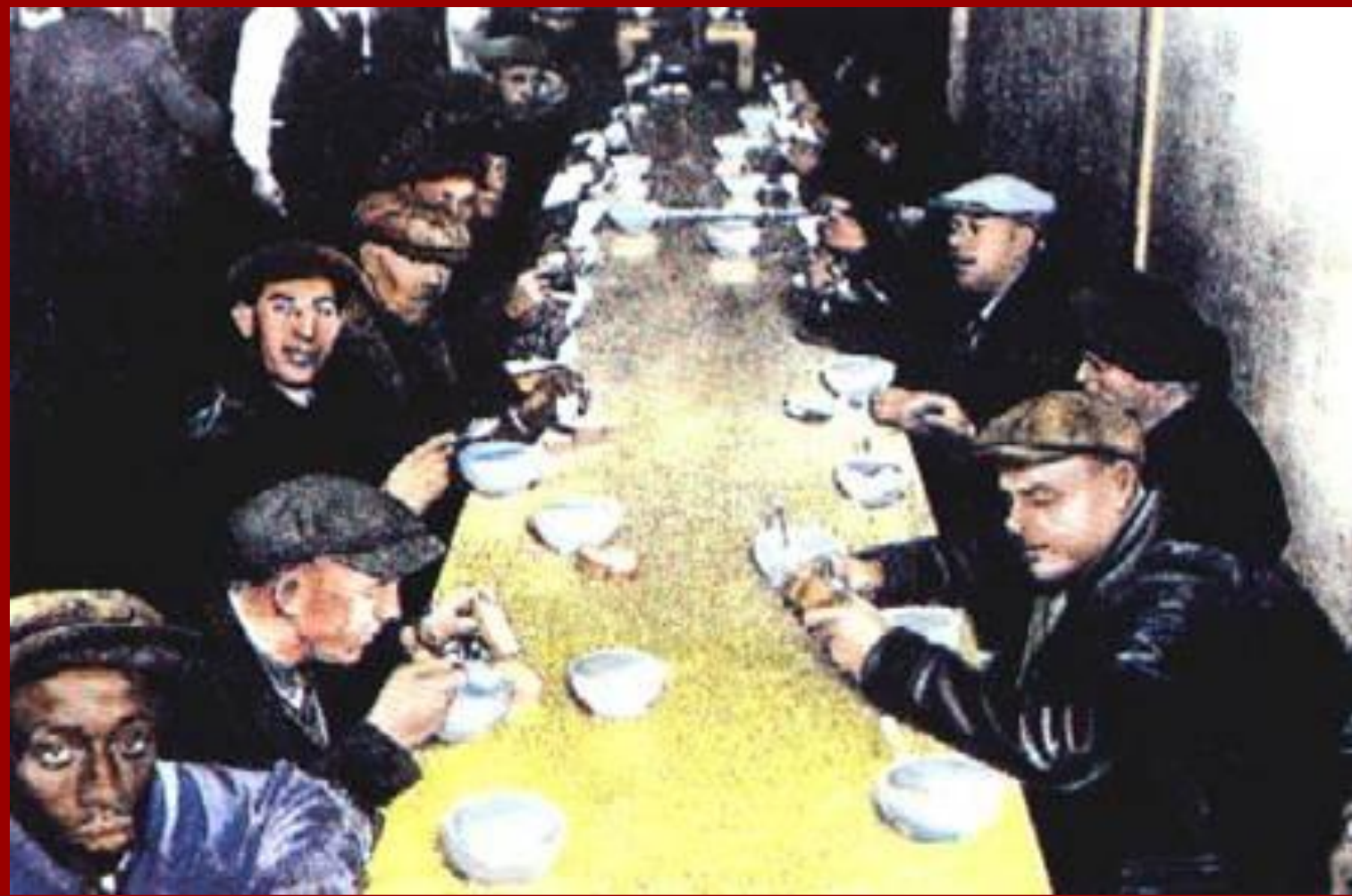
Бесплатная раздача супа.