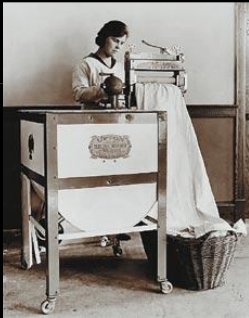
Холодильник и стиральная машина 1920-х годов