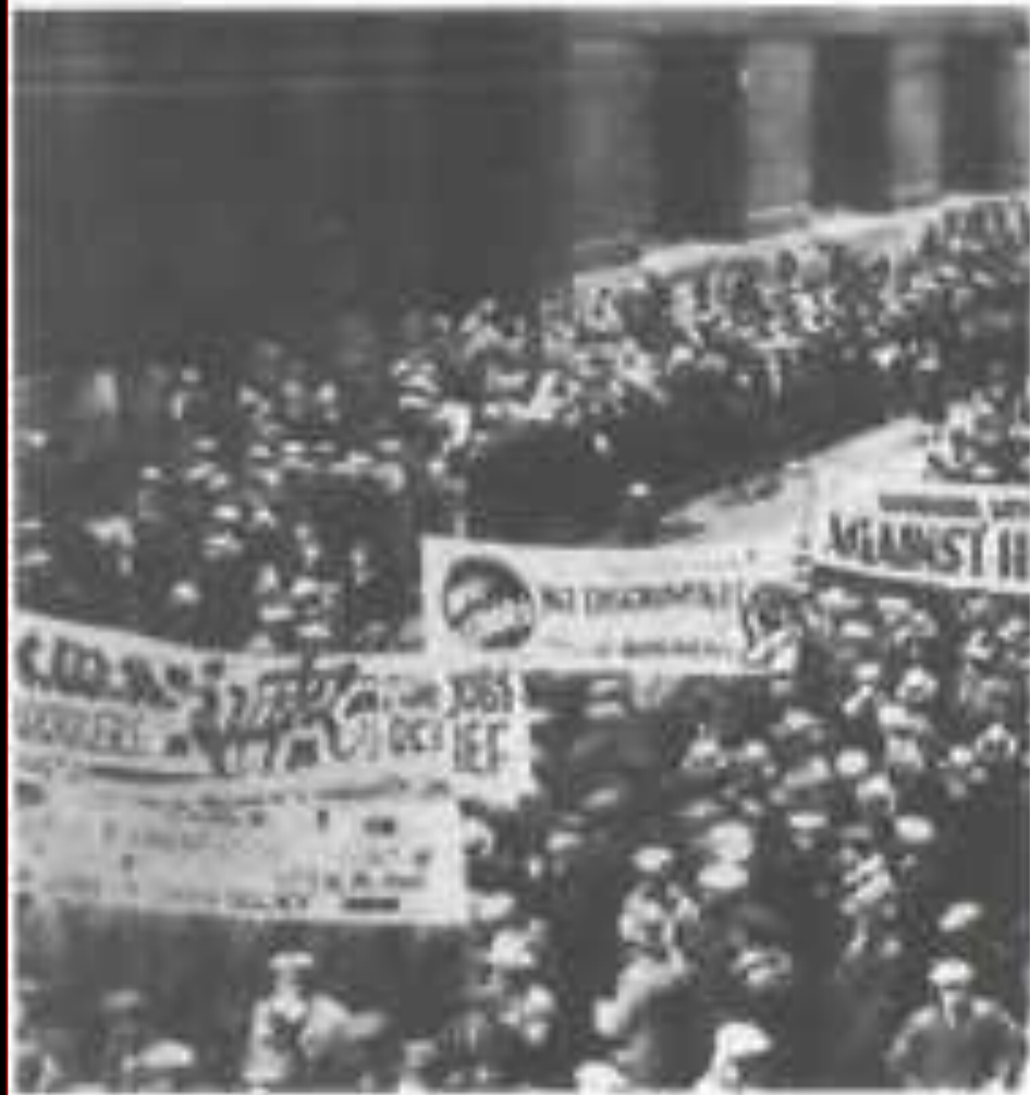
Массовая демонстрация в Англии.