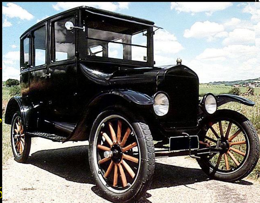
Форд, модель Т, получившая прозвище "Жестяная Лиззи".