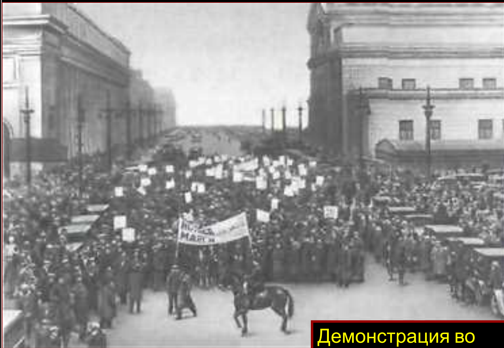
Демонстрация во Франции.