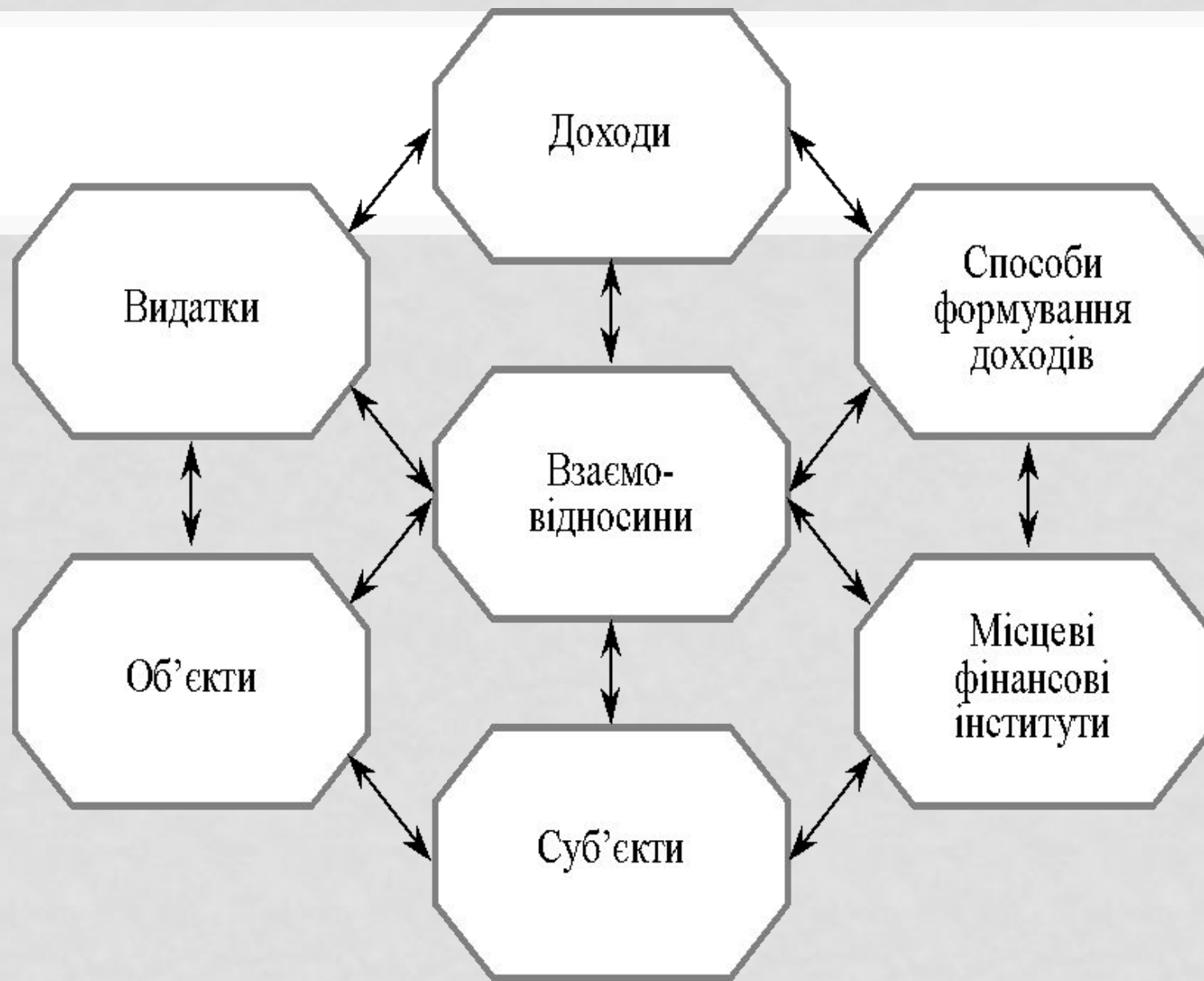
Схема 1. Взаємозв'язок у системі місцевих фінансів