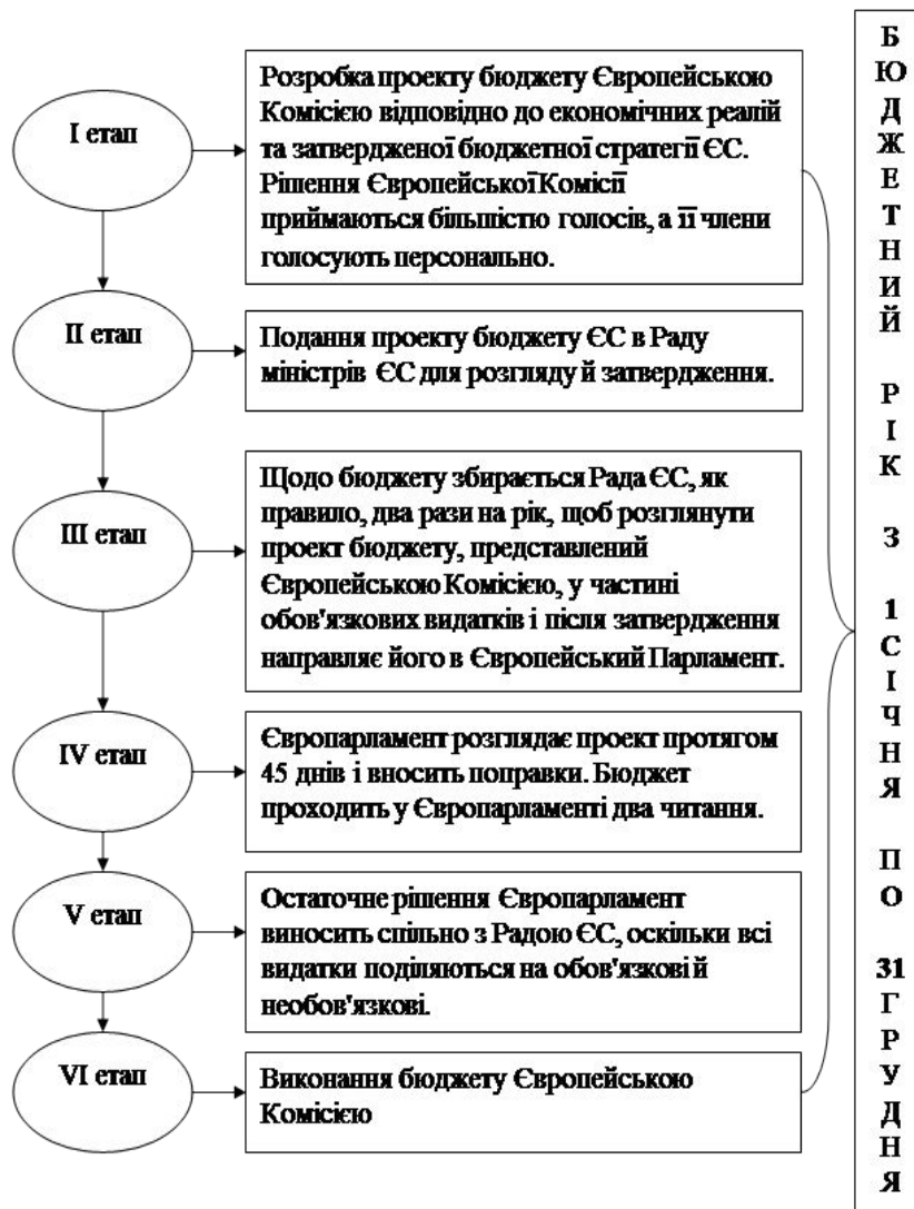
Схема бюджетного процесу по Бюджету ЄС