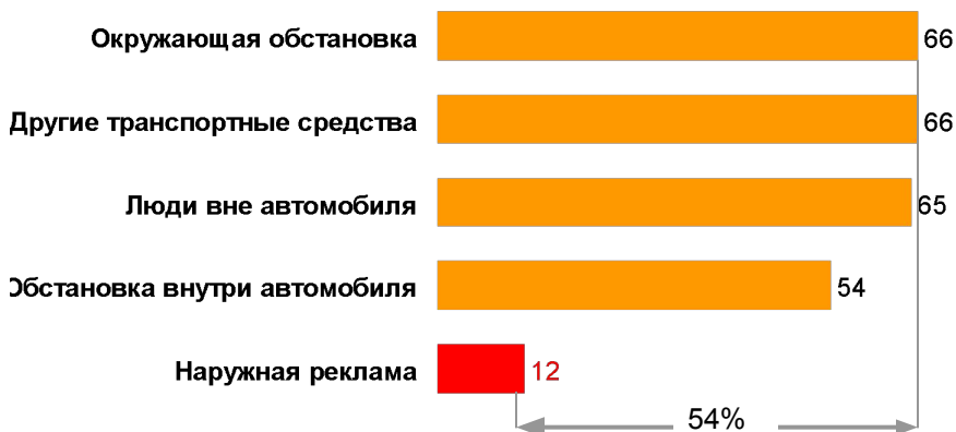
Факторы, послужившие причинами реальных аварийных ситуаций, %