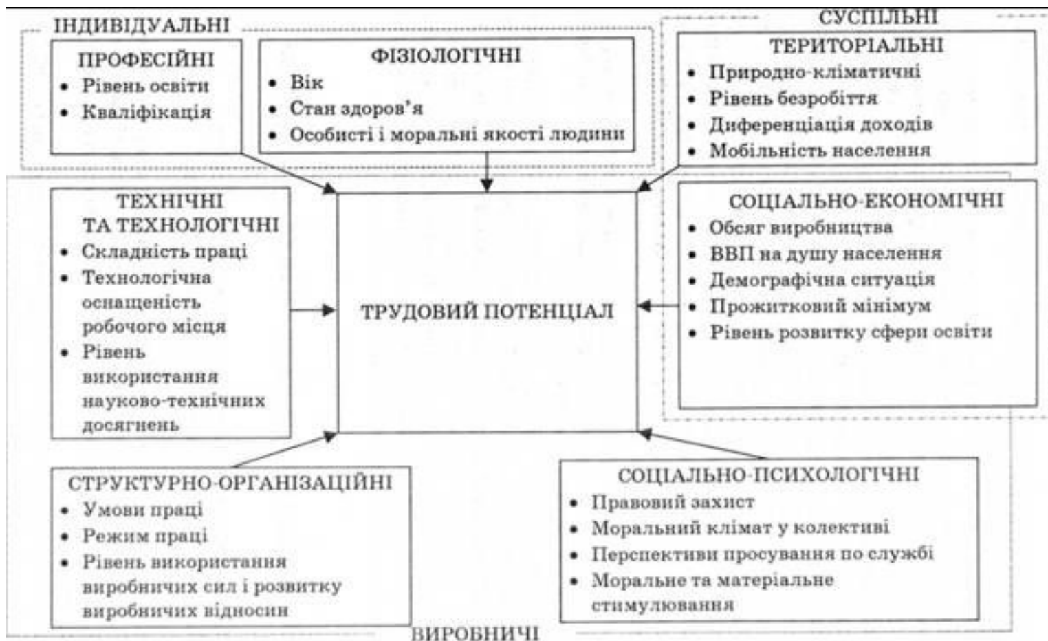
Рис. 2.3. Фактори, які впливають на розвиток трудового потенціалу суспільства