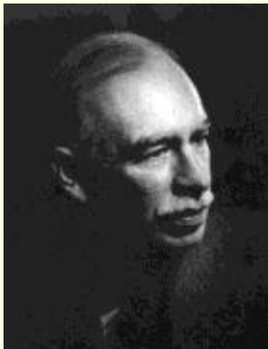
Джон Мейнард Кейнс (1883-1946)