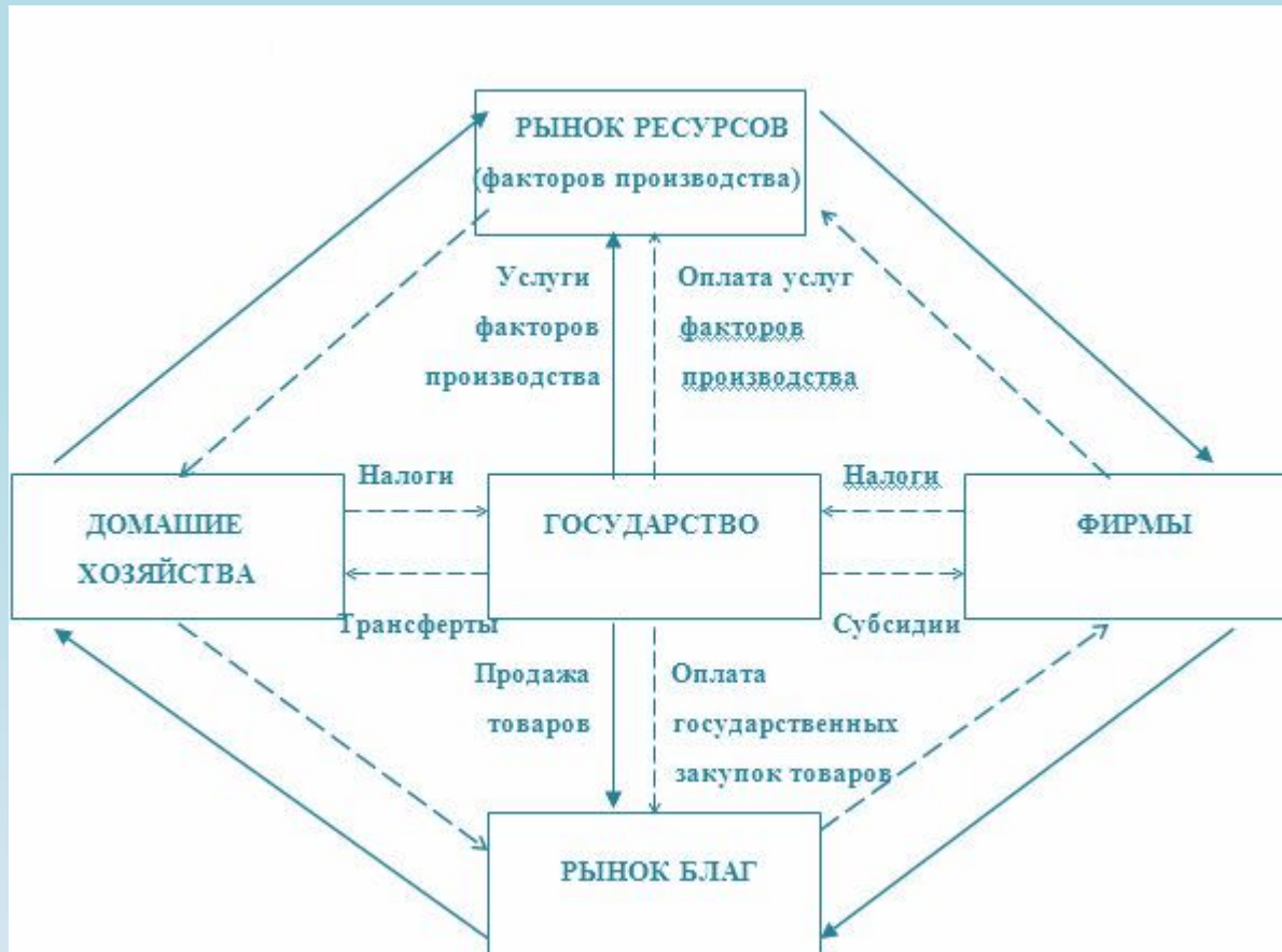
Схема кругооборота национальной экономики