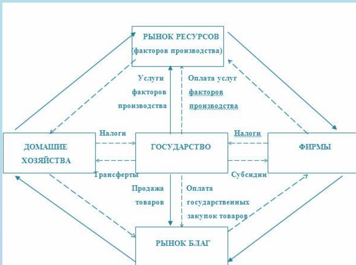
Схема кругооборота национальной экономики