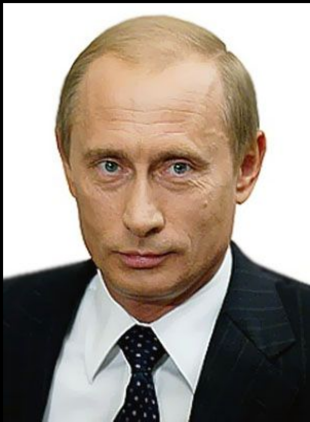
Владимир Владимирович Путин

В 2000 году с приходом В. Путина к власти им было принято решение организовать обширное и долгосрочное мероприятие под названием «приоритетные национальные проекты».