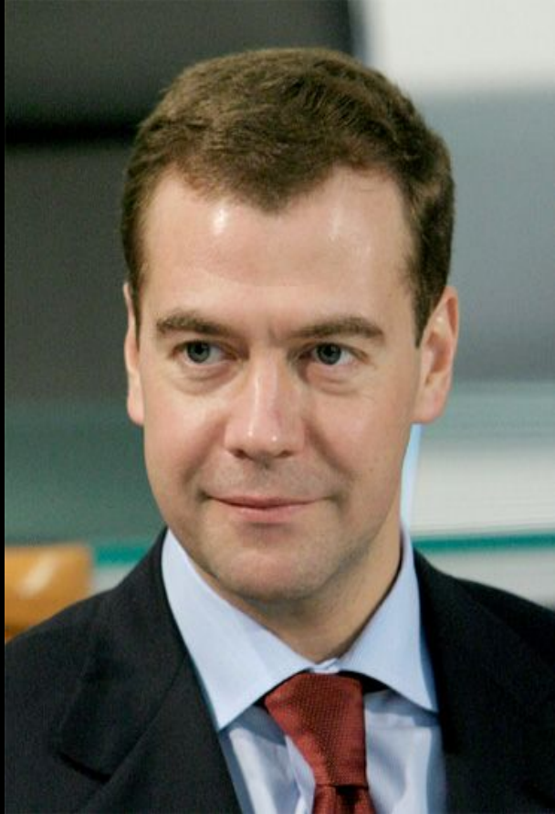
Дмитрий Анатолевич Медведев

«Задачи выполнять – системно и предельно прагматично. Ориентироваться – на достижение осязаемого результата в самой ближайшей перспективе. Параллельно – формировать новую правовую базу и совершенствовать бюджетное