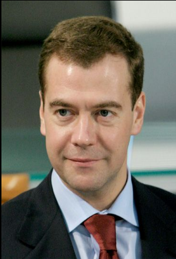
Дмитрий Анатолевич Медведев

«Задачи выполнять – системно и предельно прагматично. Ориентироваться – на достижение осязаемого результата в самой ближайшей перспективе. Параллельно – формировать новую правовую базу и совершенствовать бюджетное