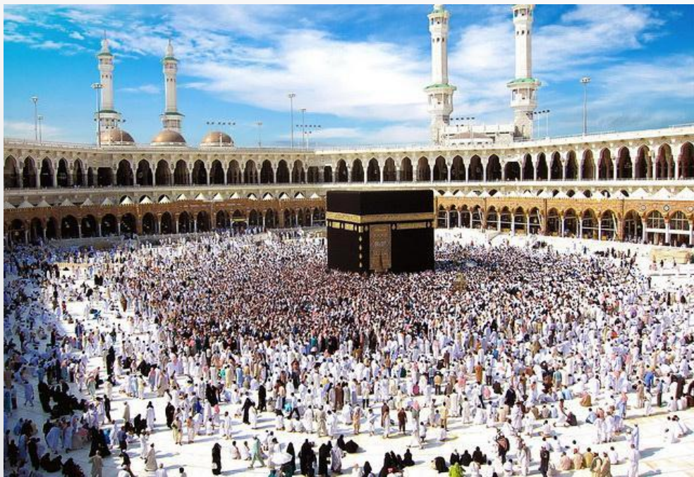
Мекке, Сауд Арабиясы