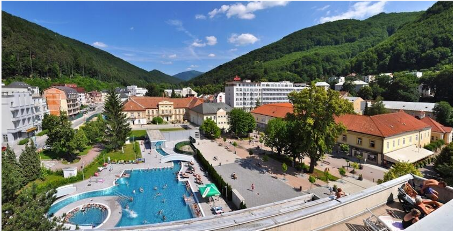
Карловы Вары, Чехия