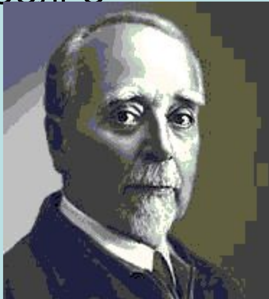
Г. Кржижановский председатель ГОСПлана

План был рассчитан на 10-15 лет и состоял из двух основных программ. Программа А предусматривала восстановление и реконструкцию довоенной электроэнергетики. Программа Б — строительство 30 электростанций (20 тепловых и 10 ГЭС) в основных регионах страны с учетом их природных ресурсов и потребностей развития промышленности