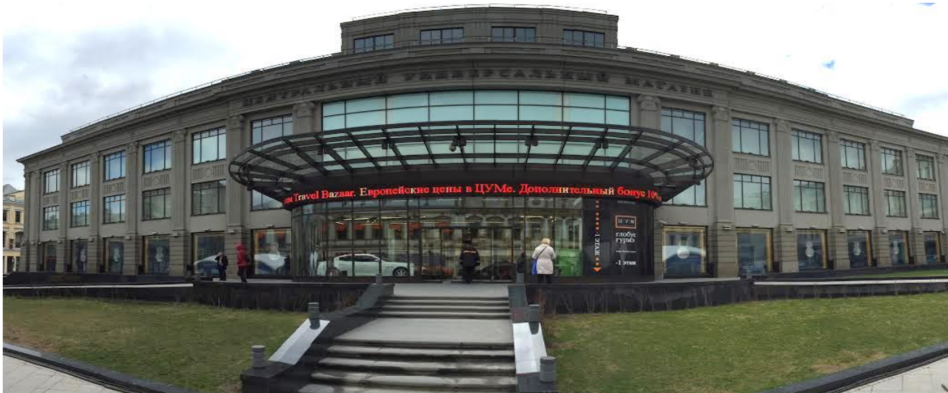
фасад здания тд. ЦУМ по ул. Кузнецкий мост