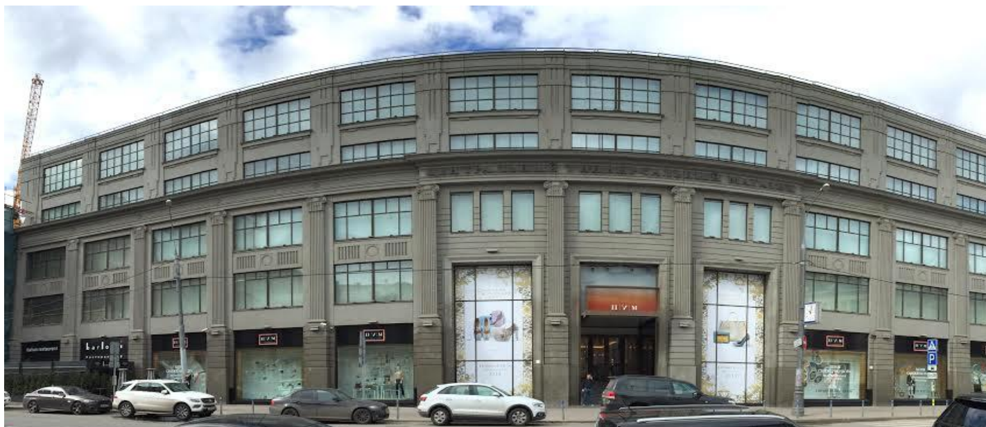
фасад здания тд. ЦУМ по ул. Неглинная