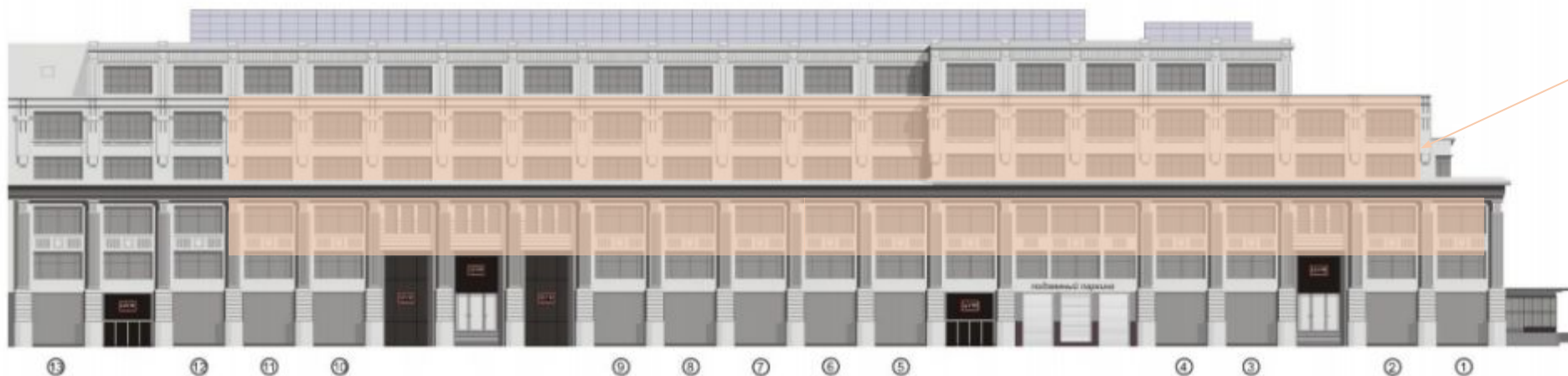
фасад здания тд. ЦУМ по ул. Неглинная