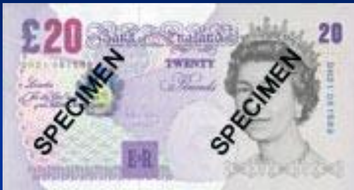
Британский фунт стерлингов