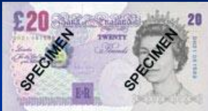
Британский фунт стерлингов