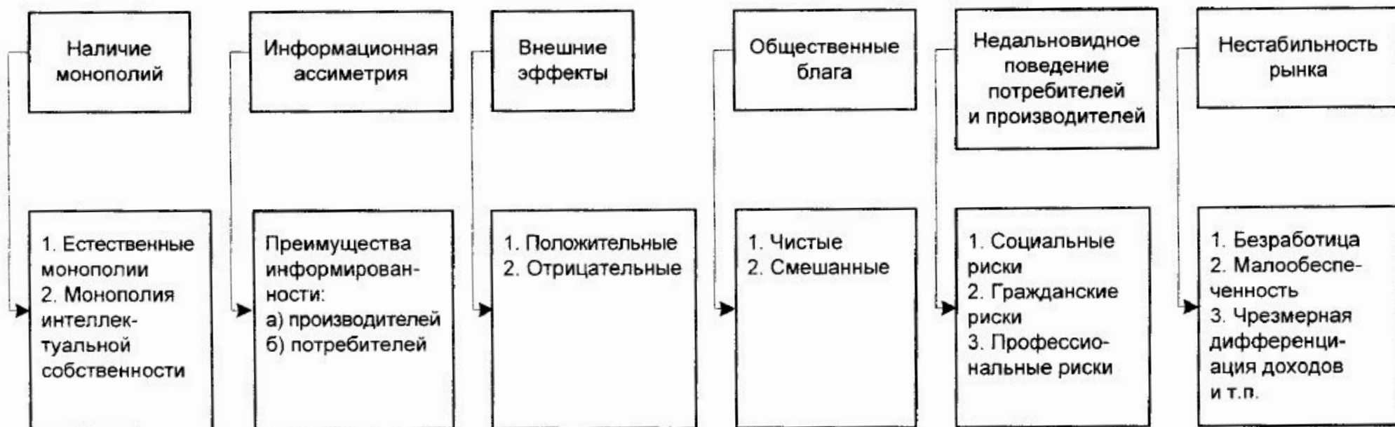
Рис. 1.3. Виды провалов рынка