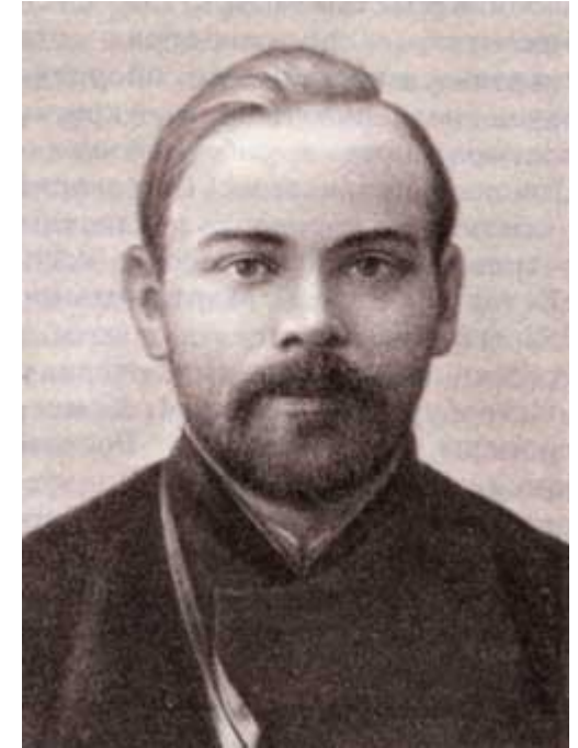
Александр Александрович Богданов