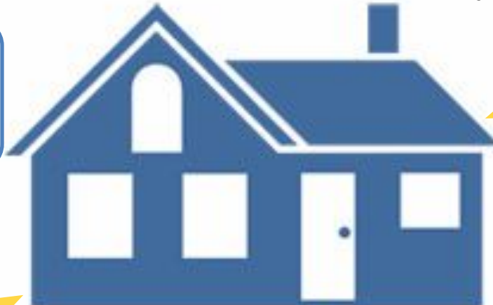
Управління соціального захисту населення