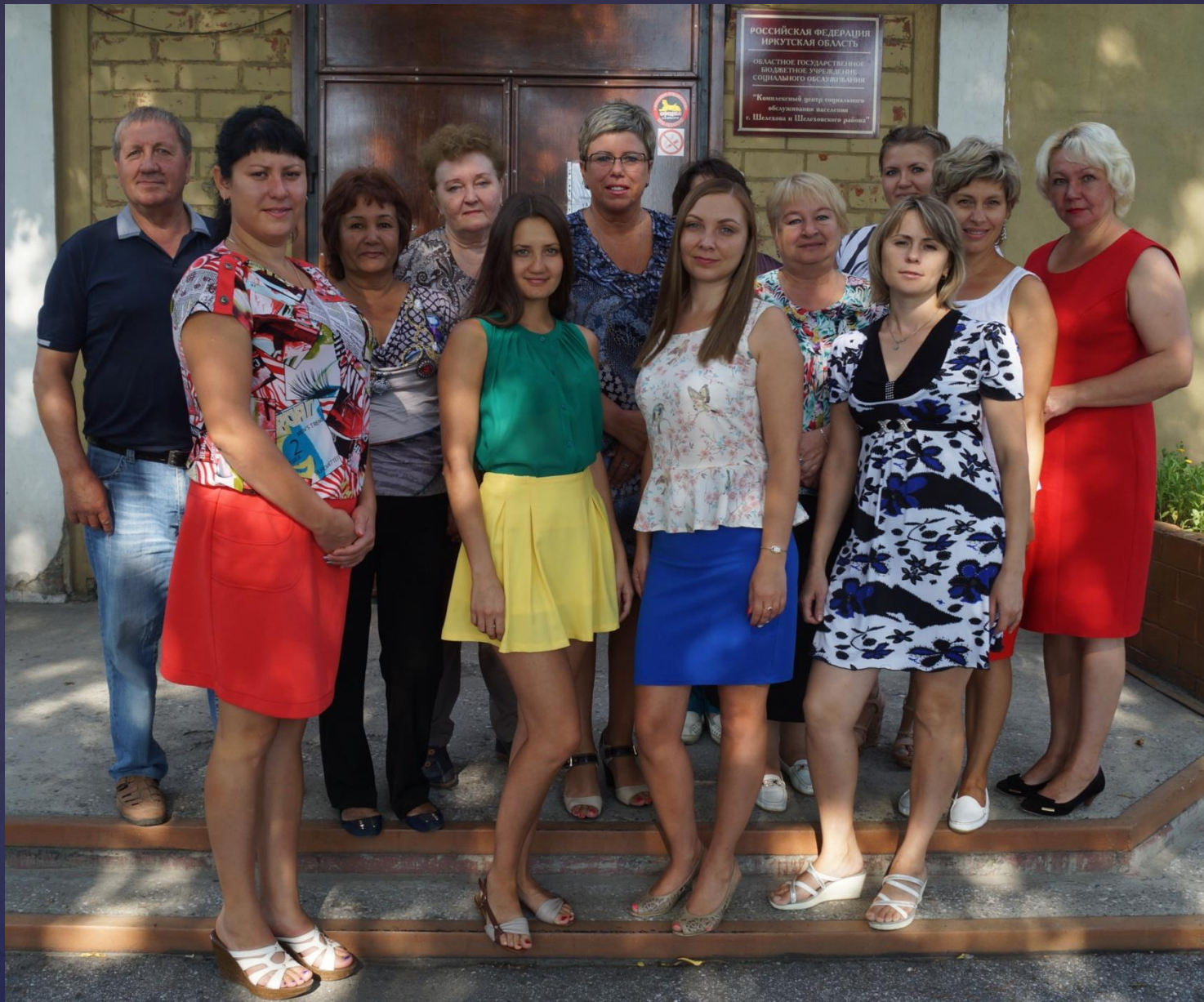
Коллектив ОГБУСО «КЦСОН г.Шелехова и Шелеховского района»