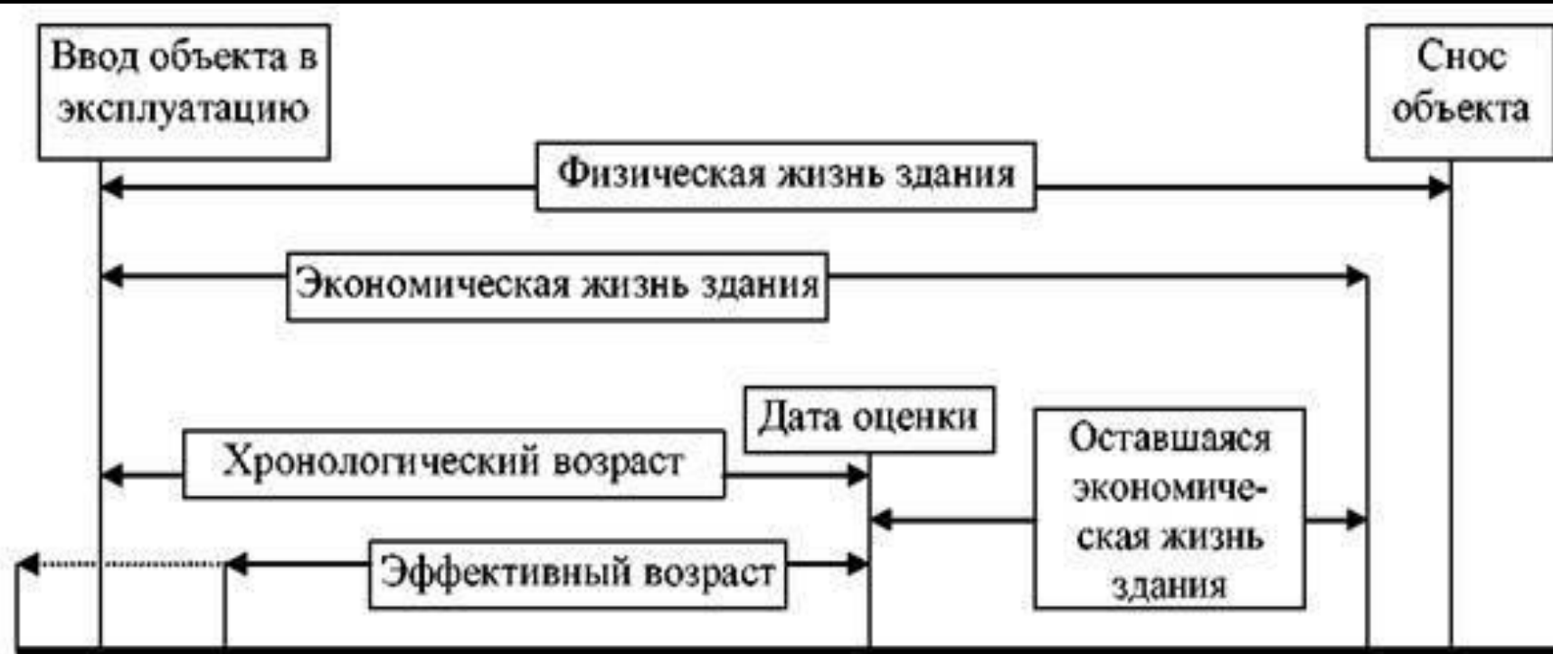
Рис. 6.2. Периоды жизни здания и характеризующие их оценочные показатели

Оставшийся срок экономической жизни (ОСЭЖ) здания – период времени от даты проведения оценки до окончания его экономической жизни.