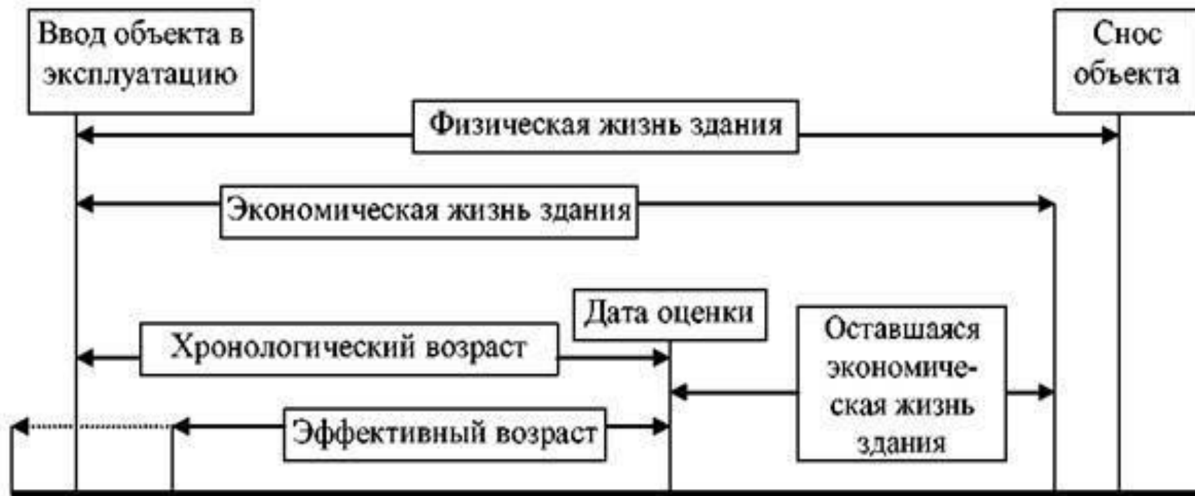
Рис. 6.2. Периоды жизни здания и характеризующие их оценочные показатели

Оставшийся срок экономической жизни (ОСЭЖ) здания – период времени от даты проведения оценки до окончания его экономической жизни.