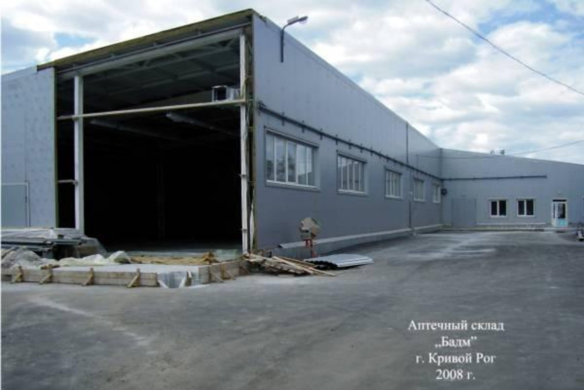
Аптечный склад „Бадм” г. Кривой Рог 2008 г.