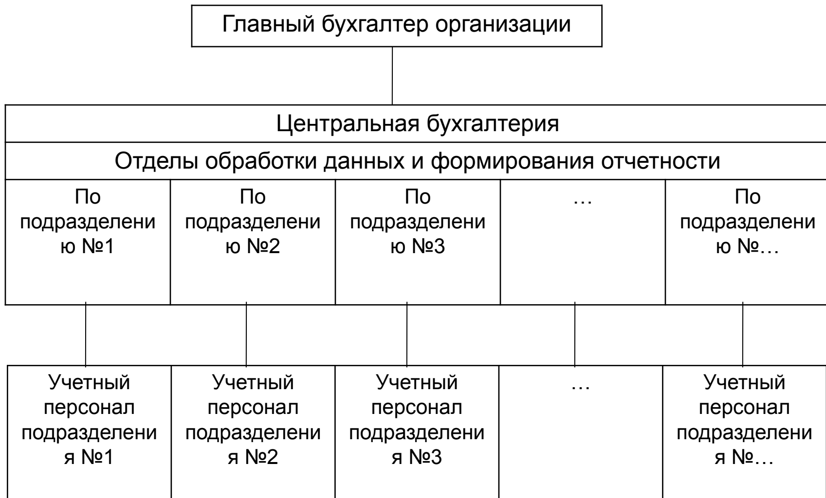
Схема линейной организации бухгалтерского аппарата