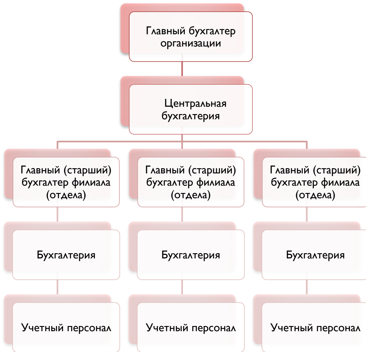
Схема децентрализованной организации учета