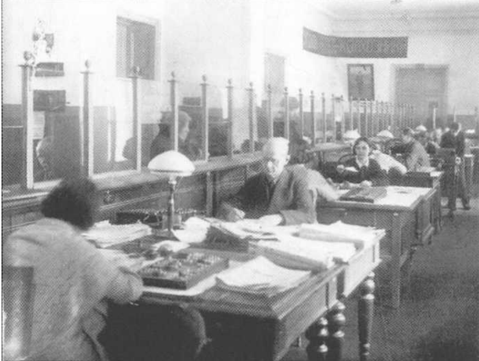
Операционный зал областной конторы Госбанка СССР в 1950-х годах.