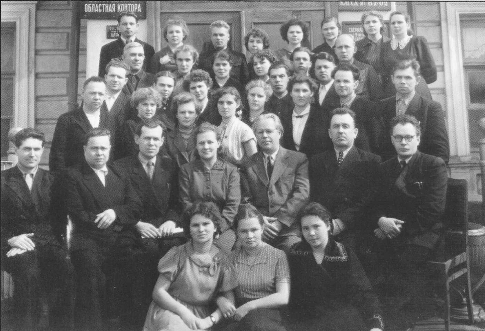
Совещание экономистов отделений Вологодской областной конторы Госбанка СССР в 1946 году.