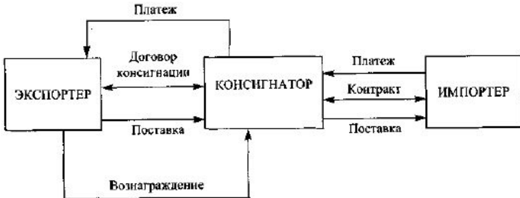
Рис. 28.5. Схема действий консигнатора