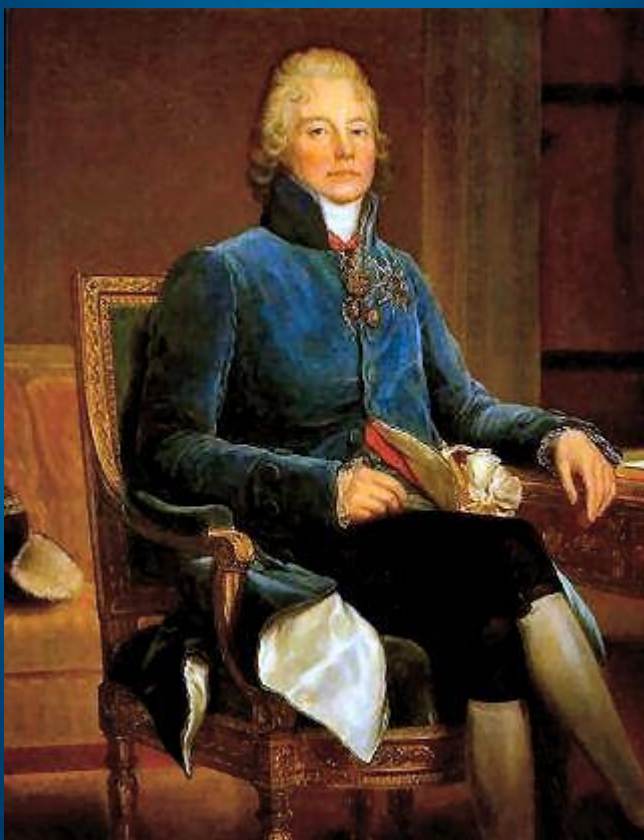
Шарль Морис Талейран-Перигор

Правду можно говорить лишь тем, кто имеет право на эту правду.