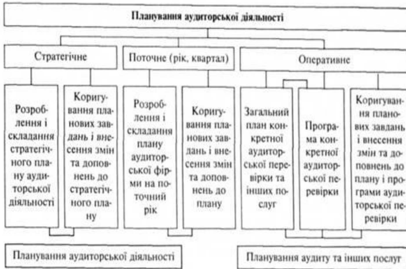
Рис. 3.1. Схема організації планування аудиторської діяльності