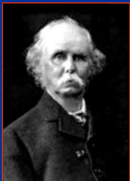
Альфред Маршалл 1842-1924

-реальный вклад в решение вопросов распределения и социальных проблем и мн.др.