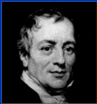
Давид Рикардо (1772-1823).

Выдающийся английский экономист Адам Смит вошел в историю как "Пророк свободной конкуренции". Величайшей его заслугой можно считать то, что в мире экономики он разглядел открытый Ньютоном в физическом подлунном мире естественный саморегулирующийся порядок. Основная идея в учении А. Смита - идея либерализма, минимального вмешательства государства в экономику, рыночного саморегулирования на основе свободных цен, складывающихся в зависимости от спроса и предложения. Главное произведение его жизни "Исследование о природе и причинах богатства народов" (1776) оказало огромное влияние на последующий век.