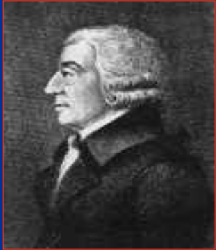
Адам Смит (1723-1790)

Выдающийся английский экономист Адам Смит вошел в историю как "Пророк свободной конкуренции". Величайшей его заслугой можно считать то, что в мире экономики он разглядел открытый Ньютоном в физическом подлунном мире естественный саморегулирующийся порядок. Основная идея в учении А. Смита - идея либерализма, минимального вмешательства государства в экономику, рыночного саморегулирования на основе свободных цен, складывающихся в зависимости от спроса и предложения. Главное произведение его жизни "Исследование о природе и причинах богатства народов" (1776) оказало огромное влияние на последующий век.