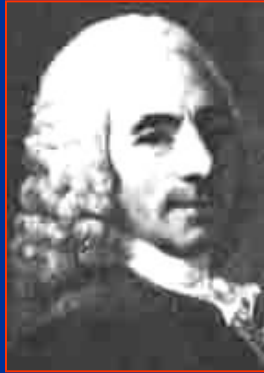
Ф. Кенэ (1694-1774)