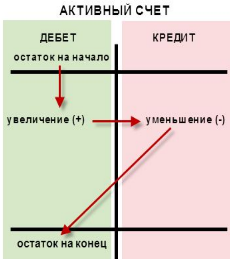
Схема активного и пассивного счетов