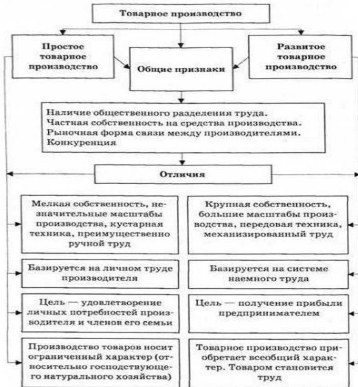
Рис. 5.13. Общие и отличительные черты простого и разви-