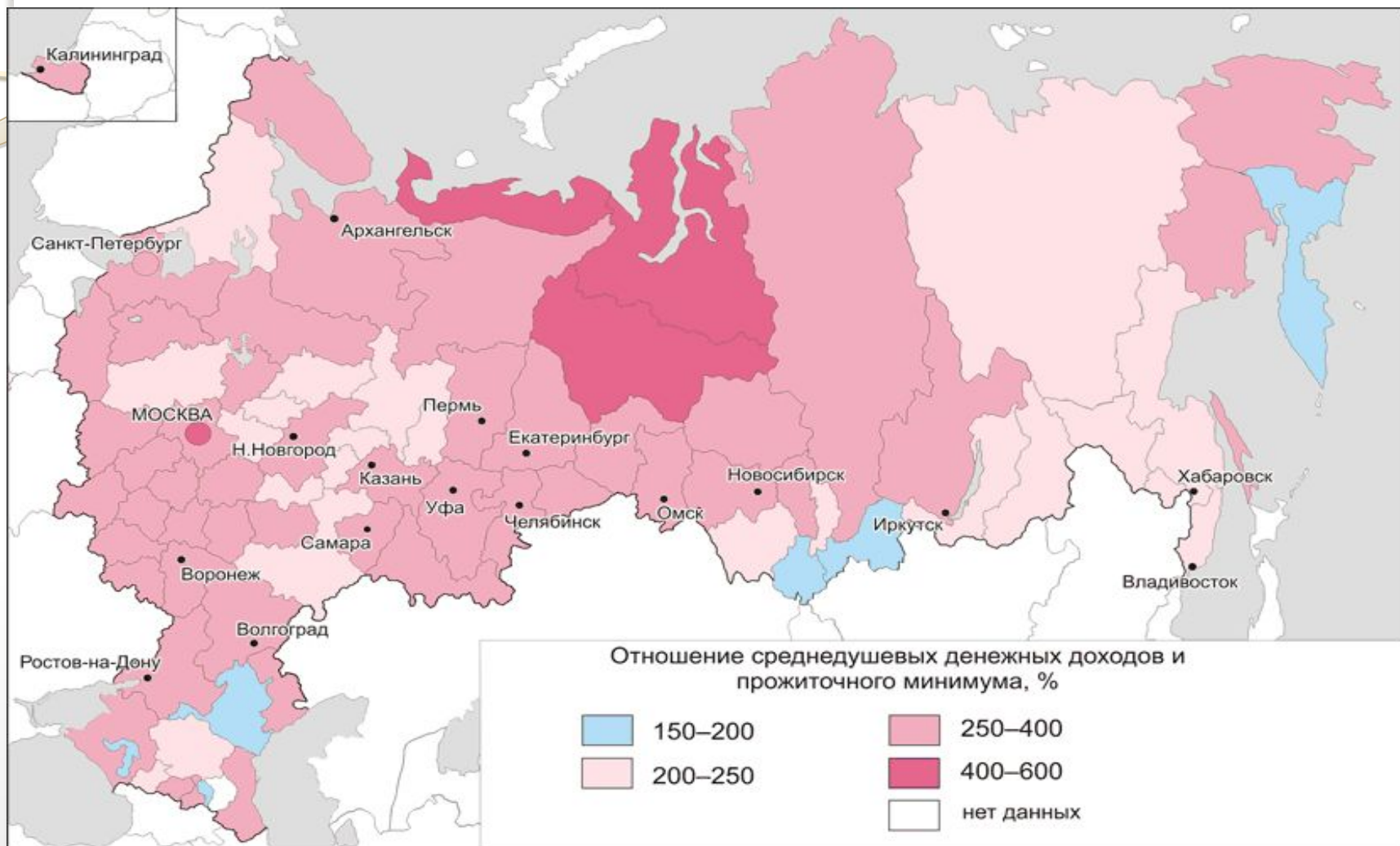
Среднендушевые денежные доходы и прожиточный минимум, 2008 г.

Важное влияние на процесс товародвижения оказывают социальные факторы , основными из которых являются: расселение населения, уровень денежных доходов населения и т. д.