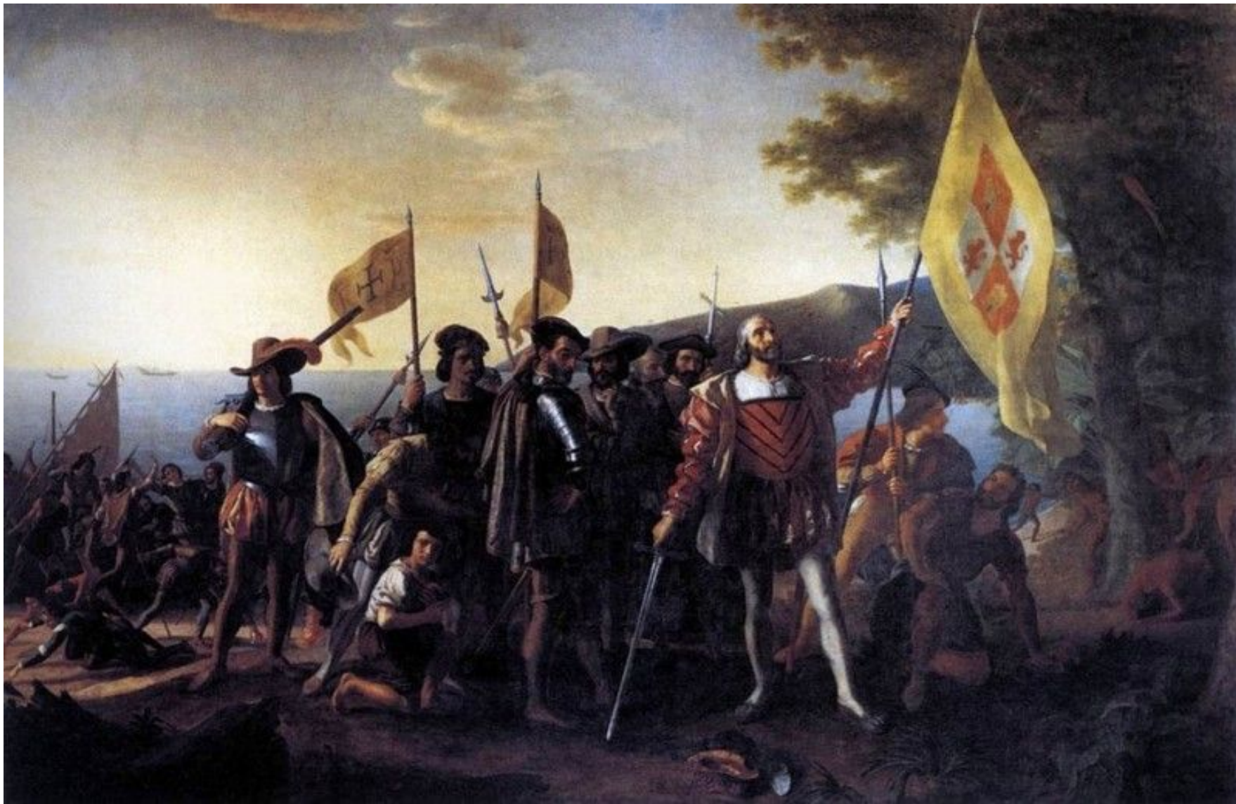
Высадка Колумба в Америке