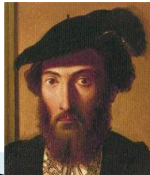
Васко да Гама