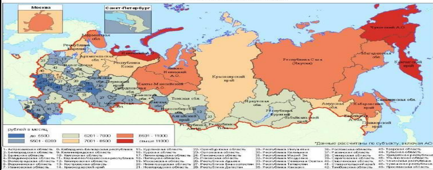
Величина прожиточного минимума за III квартал 2012 года по состоянию на 21 декабря 2012 года

Во II квартале 2004 года официальный прожиточный минимум составил 2363 руб. в месяц на человека, а доходы ниже этого уровня имели 29,8 млн человек — 20,8 % населения. По данным на IV квартал 2009 года величина прожиточного минимума — 5144 руб./месяц. Доля населения с доходами ниже прожиточного минимума — 13,1 % (2009 г.). По данным за три квартала 2012 года величина прожиточного минимума в РФ составляла 6643 руб./месяц. Доля населения с доходами ниже прожиточного минимума — 12,1 %