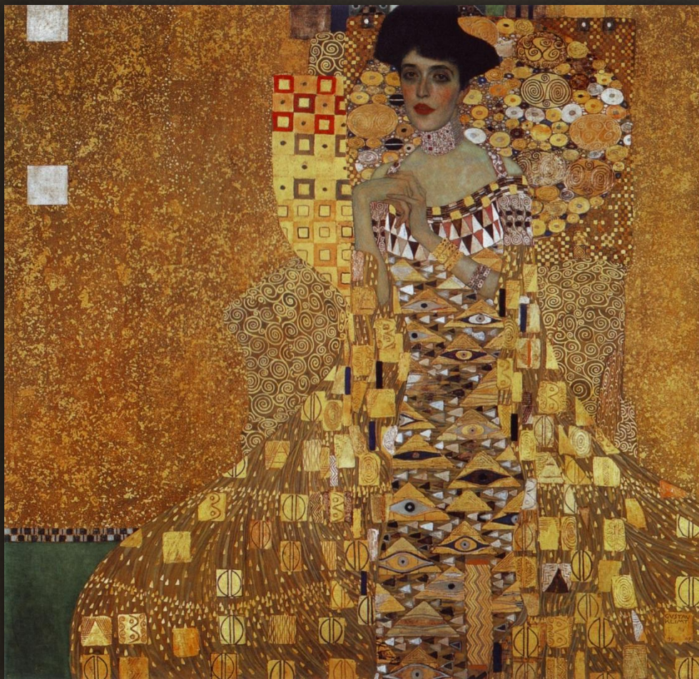
8. Густав Климт «Портрет Адели Блох Бауер», 1907 г. Цена - $135 млн., год продажи - 2006