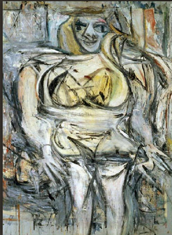
7. Виллем де Кунинг «Женщина III», 1953 г. Цена - $137,5 млн., год продажи - 2006