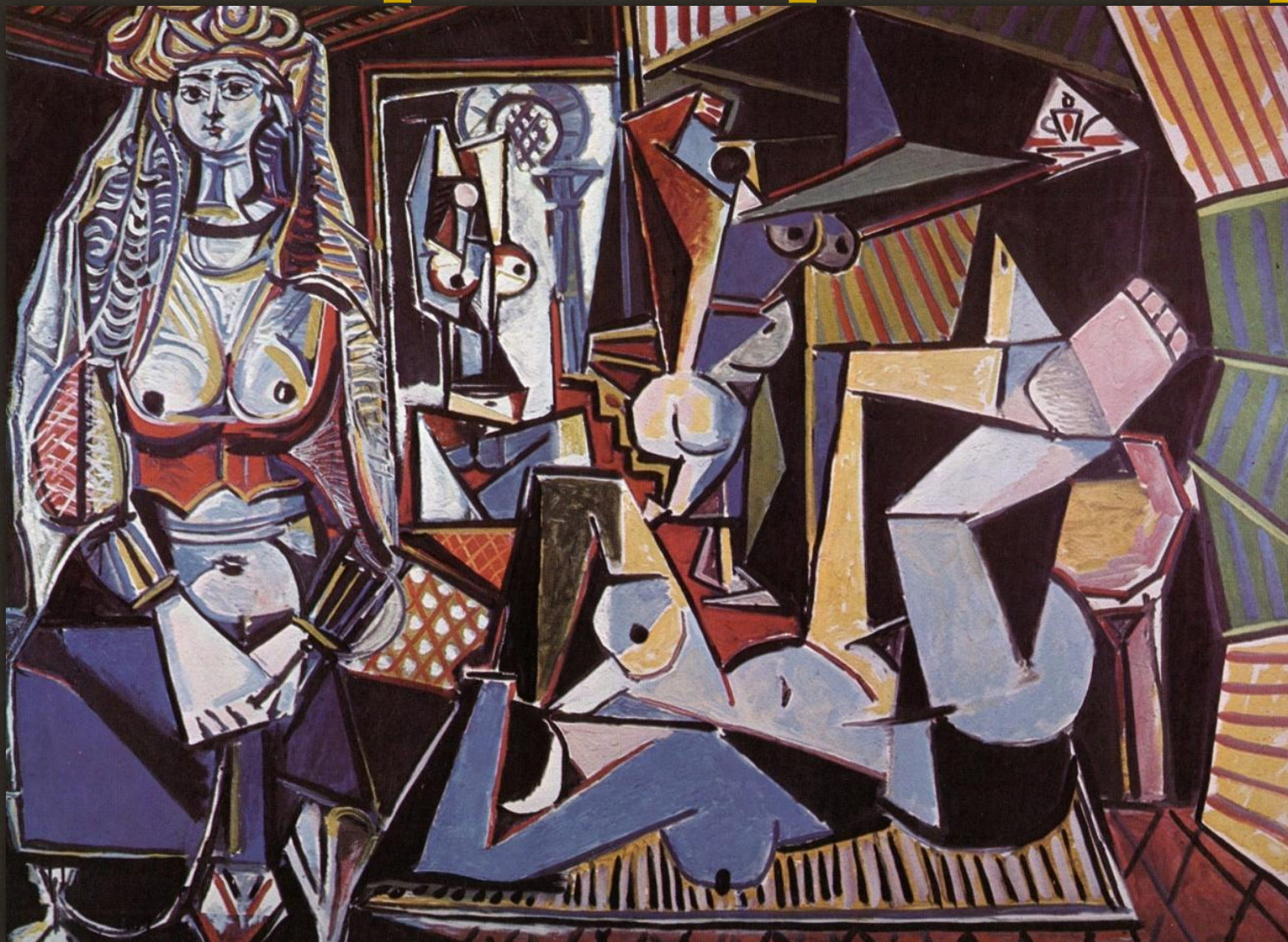
3. Пабло Пикассо «Алжирские женщины» (версия O), 1955 г. Цена - $179,365 млн., год продажи - 2015