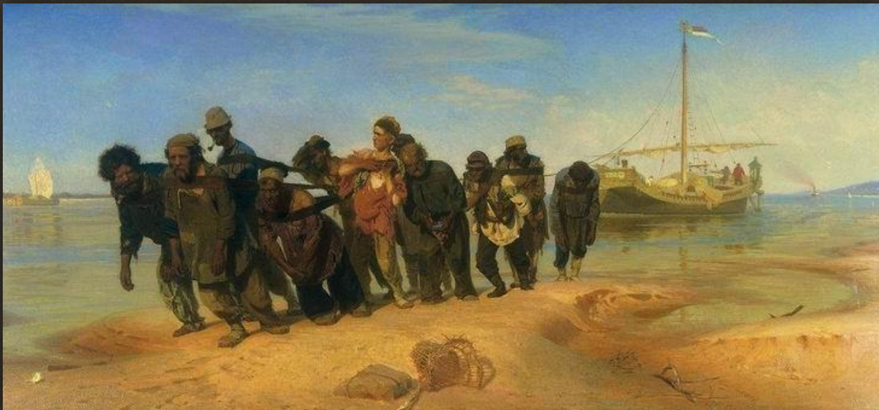
Репин Илья Ефимович «Бурлаки на Волге», 1870 г.

Особенность оценки произведений искусства состоит в большой степени индивидуализации объектов оценки .