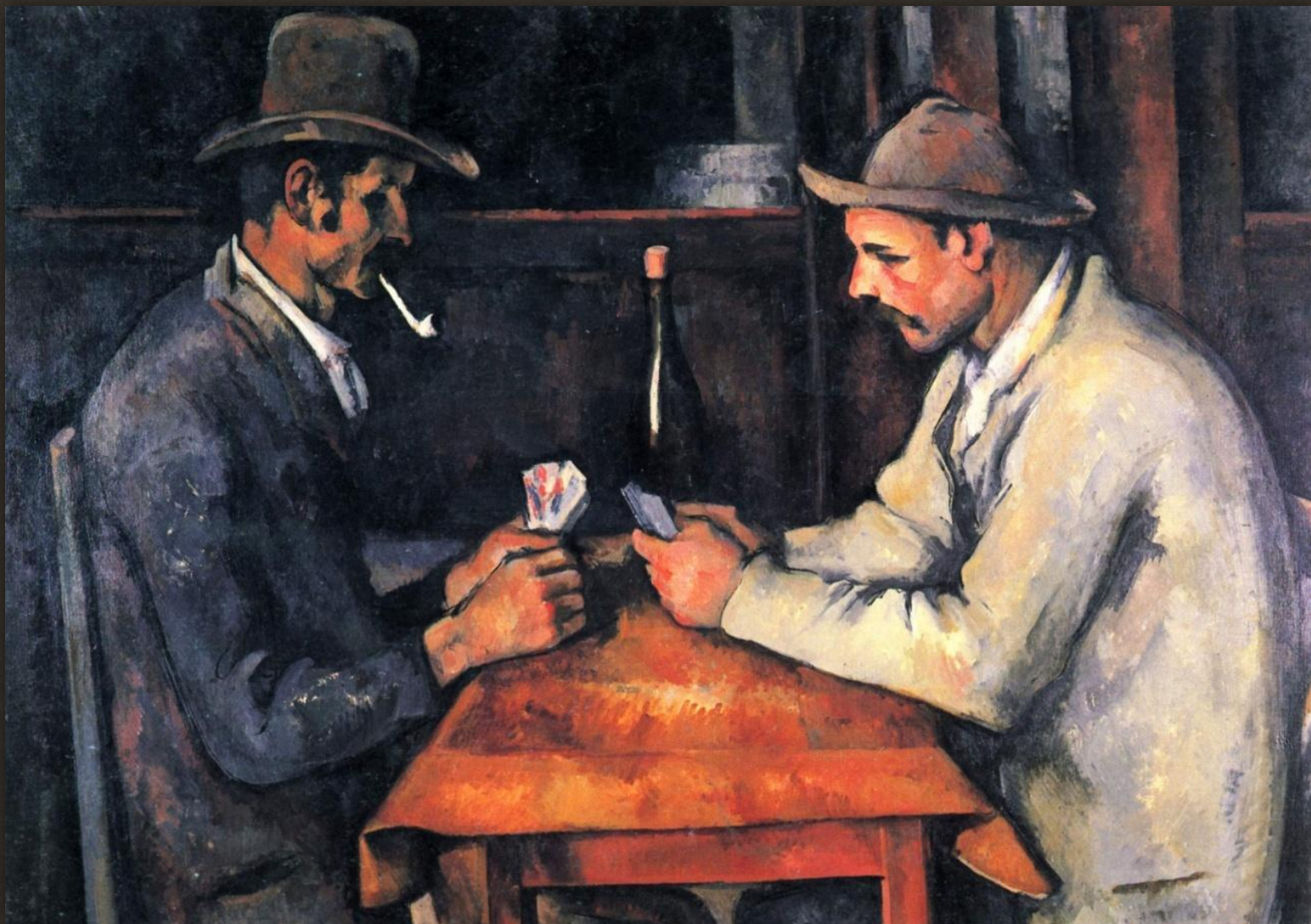
2. Поль Сезанн «Игроки в карты», 1895 г. Цена - $250 млн., год продажи - 2012