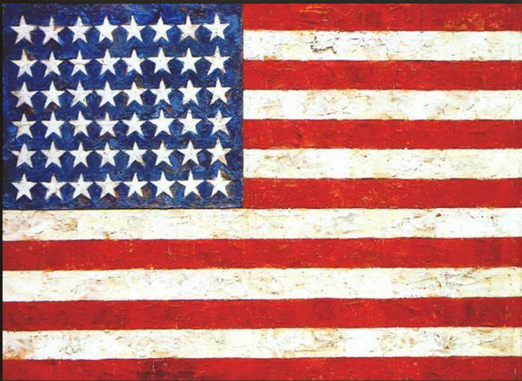
10. Джаспер Джонс «Флаг», 1932