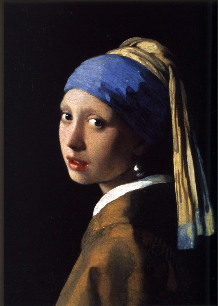
Вермеер Ян «Девушка с жемчужной сережкой», 1665 г.

Подлинным произведением конкретного художника считается лишь то, которое выполнено им собственноручно или с его непосредственным участием.