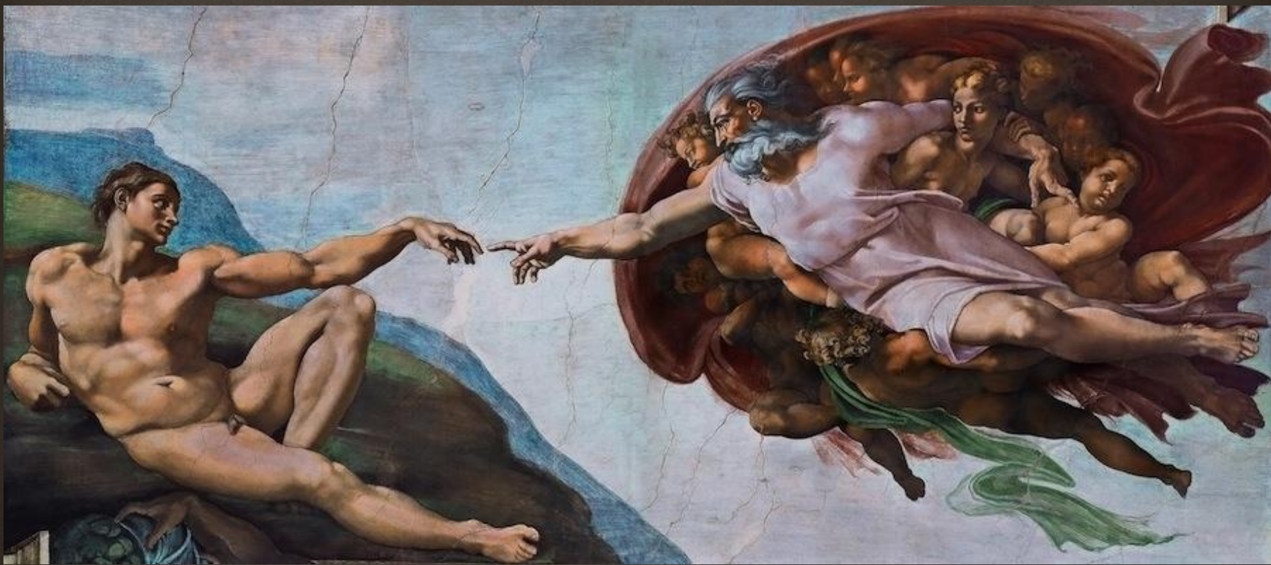
Микеланджело Буонарроти «Сотворение Адама», 1511 г.

Произведение искусства — объект, обладающий эстетической ценностью; материальный продукт художественного творчества, сознательной деятельности человека.