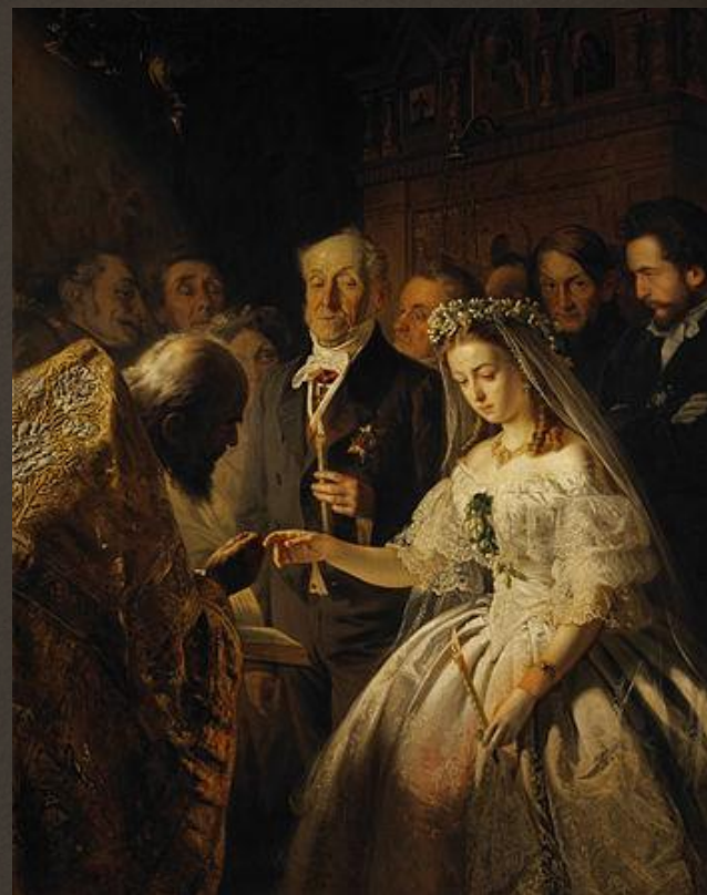
Пукирев Василий Владимирович «Неравный брак», 1862 г.

Фотографические изображения оцениваемого предмета.