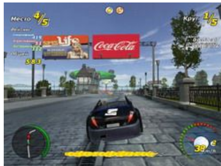
Компьютерная игра «Адреналин», реклама Соса-Сола