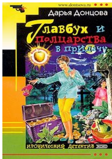
Книга Дарьи Донцовой «Главбух»