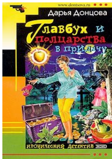
Книга Дарьи Донцовой «Главбух»